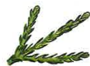
Tasmaanse bergceder (p. 58)