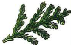
Dropceder (p. 30)