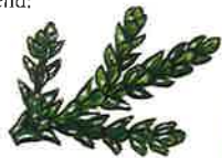
Hibacipres (p. 32)