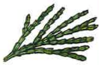
Wierookceder (p. 30) schijnbaar 'uitgerekt'