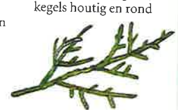
Gladde bergceder (p. 58)