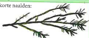
Chinese jeneverbes en Rode ceder (p. 56)