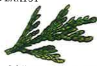
Schijncipressen (p. 36)