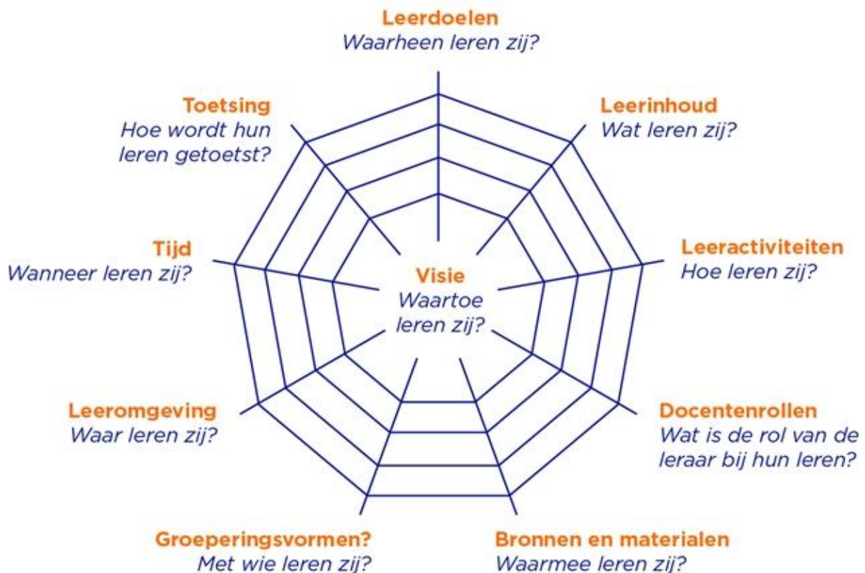
Afbeelding 1. Curriculaire Spinnenweb (Van den Akker, 2003)

Wanneer je onderwijs ontwikkelt, zoals een les of lespakket, dan wil je dat het logisch in elkaar zit. Het curriculaire spinnenweb (Van den Akker, 2003) is een model dat helpt om de doelen van onderwijs uit te werken naar alle onderdelen van het curriculum. Elk draad van het curriculaire spinnenweb gaat over een kernvraag met betrekking tot het leren van de leerlingen. In het midden van het curriculaire spinnenweb staat het onderdeel 'visie', dat de verbindende schakel vormt naar de andere onderdelen, die ook onderling met elkaar verbonden zijn. Door na te denken over de verschillende onderdelen, zorg je voor consistentie en samenhang in je onderwijs.