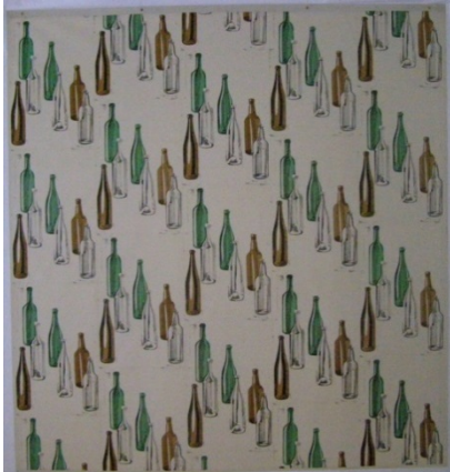
Willem Oorebeek, Tartan, 1987