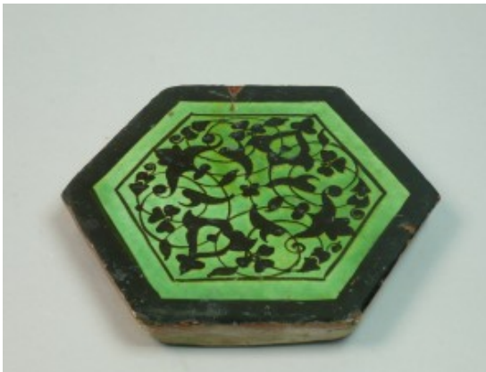
Tegel, anoniem 1400-1425