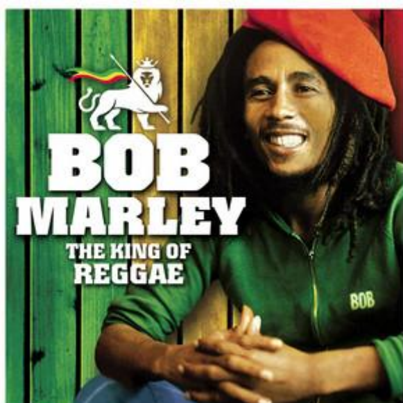
Bron 4: Bob Marley, the king of reggae

In Jamaica bijvoorbeeld heeft het toerisme bijgedragen aan het besef van de waarde van de eigen cultuur door middel van muziek, met name reggae. Reggae, met zijn wortels diep geworteld in Jamaicaanse tradities en geschiedenis, heeft wereldwijde bekendheid gekregen dankzij toeristen die naar het eiland komen om te genieten van de muziekcène. Het toerisme heeft zo in Jamaica geleid tot een grotere waardering voor de eigen lokale cultuur.