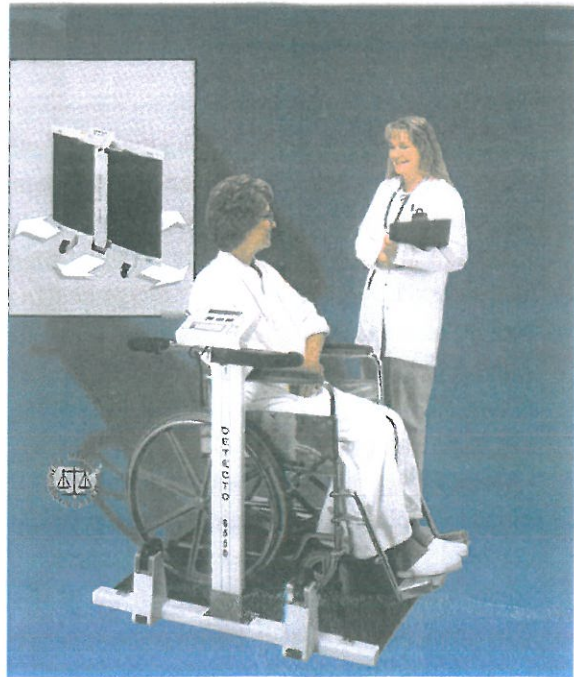
Figuur . Een weegstoel die bestemd is voor een rolstoelgebruiker

Er zijn verschillende soorten weegschalen om het lichaamsgewicht te bepalen, zoals de voetweegschaal, weegstoel en de snelweger.