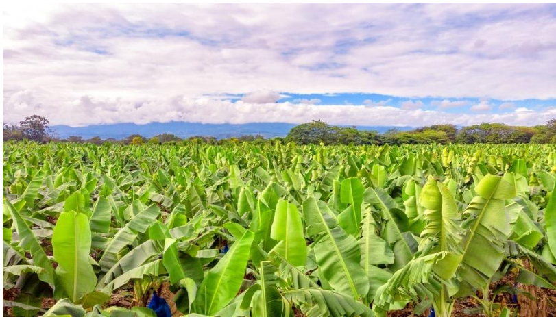
Bron 2: Chiquita bananen

Een voorbeeld van een bedrijf dat investeert in het Caribisch gebied is Chiquita Brands International, een van de grootste bananenproducenten en -distributeurs ter wereld (zie bron 2). Zij investeren in moderne landbouwtechnieken, kwaliteitscontrole en distributiekkanalen. Ze werken vaak samen met lokale boeren, die profiteren van de technische knowhow en de wereldwijde markttoegang. Zo'n samenwerking tussen twee partijen wordt wel een joint-venture genoemd.