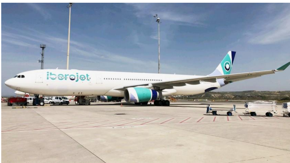
Bron 1: Spaanse luchtvaartmaatschappij start dochterbedrijf in Dominicaanse Republiek

Deze strategie gaat over het investeren in infrastructuur zoals wegen, havens, luchthavens en communicatienetwerken. Doel van de investeringen is de economie te verbeteren. De Dominicaanse Republiek bijvoorbeeld heeft aanzienlijke investeringen gedaan in de ontwikkeling en modernisering van luchthavens in het hele land (zie bron 1). Deze investeringen hebben onder andere tot doel de toeristische sector te stimuleren en de economische groei te bevorderen.