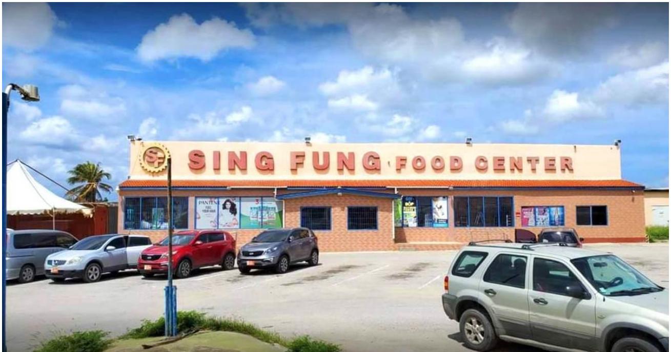
Bron 16: Sing Fung is een voorbeeld van een Chinese supermarkt op Aruba

De toename van de invloed van China heeft naast voordelen ook nadelen.