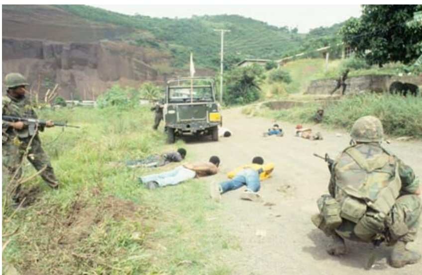
Bron 15: Amerikaanse invasie in Grenada in 1983

De Verenigde Staten hebben in het verleden politieke inmenging in enkele Caribische landen gepleegd. Deze inmenging heeft gevolgen gehad voor de politieke stabiliteit in de regio. Zo was er een militaire invasie van de Verenigde Staten in oktober 1983 op het eiland Grenada. Deze invasie vond plaats na een gewelddadige staatsgreep in Grenada, waarbij de linkse regering van Maurice Bishop werd afgezet en later vermoord. De Verenigde Staten rechtvaardigden de invasie door te beweren dat Amerikaanse burgers in gevaar waren en dat ze de orde en stabiliteit in Grenada moesten herstellen.