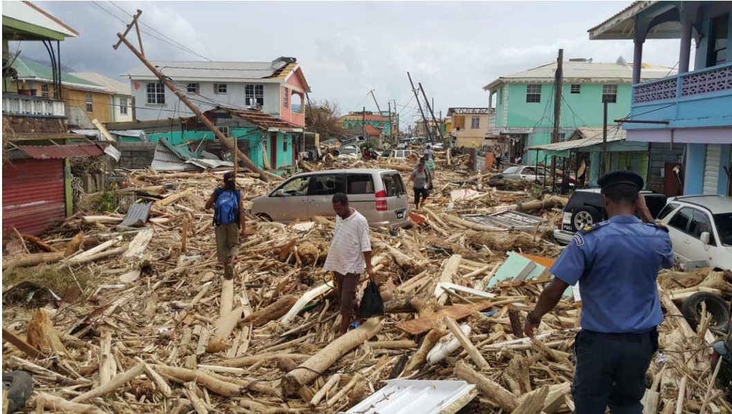
Bron 11: Noodhulp - Nederland helpt Caribisch eiland Dominica na orkaan Maria in 2017