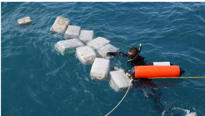
Bron 12: Een grote drugsvangst in de Caribische zee.

Door de ligging zijn de landen in het Caribisch gebied vaak een doorvoerpunt voor drugs. Het gaat vooral om cocaïne vanuit Zuid-Amerika op weg naar Noord-Amerika en Europa. De handel en de bijbehorende criminaliteit wordt met behulp van internationale instanties bestreden. Een voorbeeld is de samenwerking met de Amerikaanse DEA (Drug Enforcement Administration). Een ander voorbeeld is de ondersteuning die Nederland geeft aan Aruba en Curaçao. Deze ondersteuning bestaat uit het verstrekken van financiële middelen, het delen van inlichtingen en expertise, het bieden van training en materiële ondersteuning aan de lokale autoriteiten, en soms uit de aanwezigheid van politiepersoneel (marechaussee) uit Nederland.