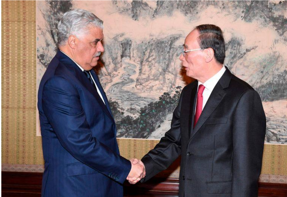
De vicepresident van China schudt de handen met de Dominicaanse minister van Buitenlandse Zaken.

Na het aanknopen van de diplomatieke banden zijn de relaties tussen China en de Dominicaanse Republiek versterkt, met onder meer: