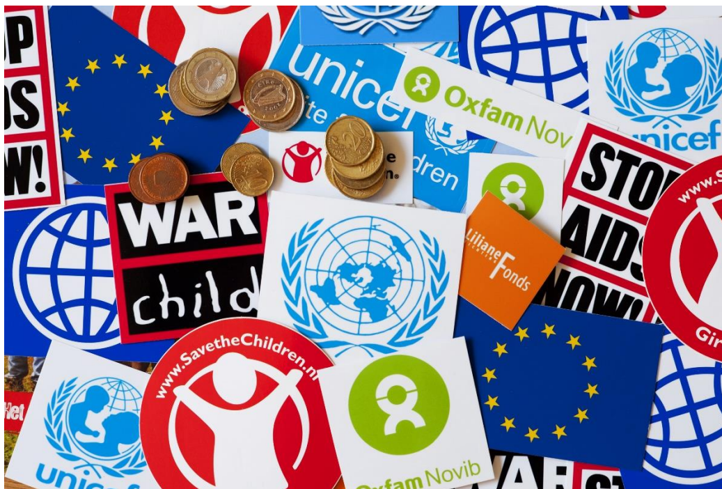
Bron 10: Veel verschillende organisaties betrokken bij ontwikkelingshulp.