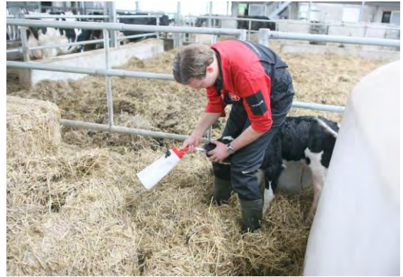
Met de fles naar beneden langzaam sonde eruit halen