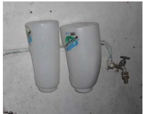
Flessen ophangen om leeg te lekken

Belangrijk is, wanneer de fles goed gereinigd is, dat deze goed kan opdrogen en schoon wordt weggehangen. Bijvoorbeeld zoals op de manier op de foto rechts.