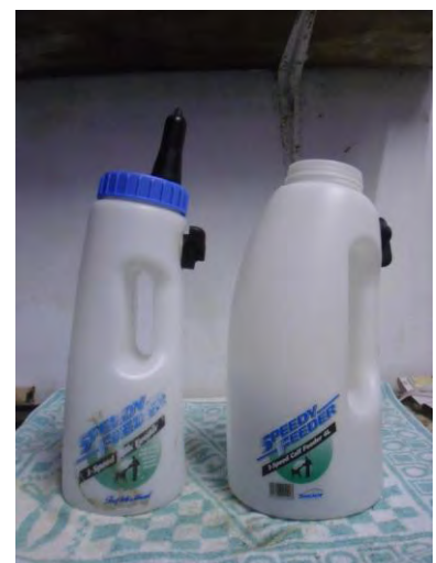
Kerlb Speedy Feeder®