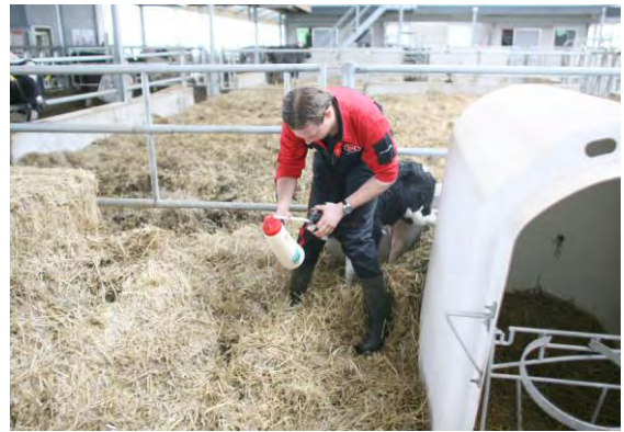
Vinger in de bek + Sonde inbrengen (fles geknikt)