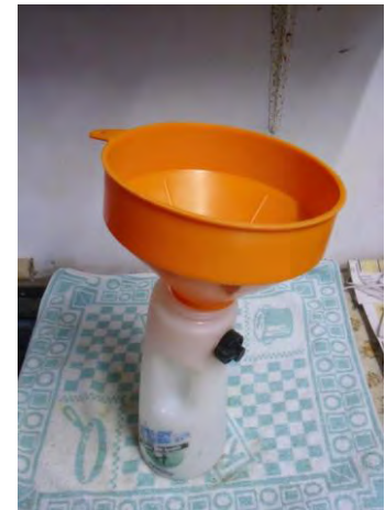
Fles vullen met trechter

De biest kan rechtstreeks vanuit de emmer in de fles gegoten worden. Wanneer dit onhandig is kan er ook gebruik gemaakt worden van een trechter. Hierbij is het praktisch wanneer er gebruik gemaakt wordt van een trechter met een iets opstaande rand, zodat er minder biest gemorst wordt en de trechter goed hanteerbaar is.