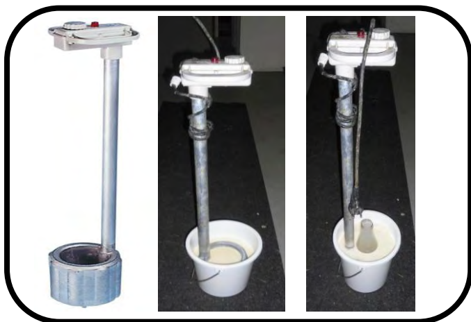
Warmte element: A (matig)

→ Voorkeur: warmte element in foto B, geen problemen met een te laag melk niveau.