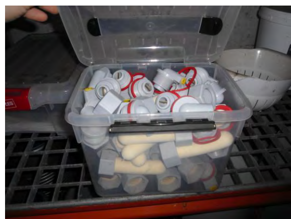
Onderdelen speenemmer bewaren