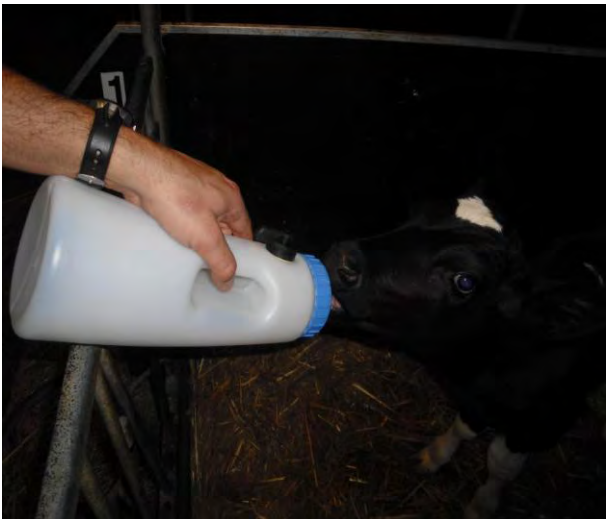
Kalf zelf fles leeg laten drinken

Het kalf kan vast gehouden worden, indien het een levendig kalf is die moet leren drinken, door erover heen te gaan staan en de kop tussen de knieën te houden, zie de foto rechtsonder. De speen van de fles kan dan aan het kalf aangeboden worden, zodat hij kan drinken. Door middel van de dosator knop kan extra lucht toegevoegd worden, zodat de biest makkelijker beschikbaar is voor het kalf.