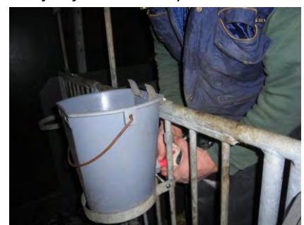
Kalf helpen te drinken uit speenemmer