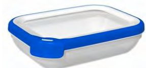
Curver Chef@home® bakje 1.2L

De voorkeur gaat uit naar de Curver Chef@home® bakjes met een volume van 1,2 liter. Het voordeel is dat dit een plat bakje met een groot contact oppervlak is en eenvoudig te reinigen is.