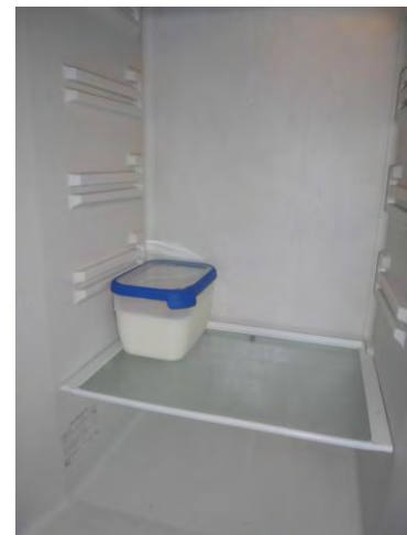
Biest bewaren in koelkast

De bakjes (Curver Chef@home®) op de foto hebben een inhoud van 2,5 liter. Bij andere gewenste hoeveelheden per voerbeurt zijn er ook bakjes in ander maten verkrijgbaar, namelijk 1,2 liter / 1,8 liter / 2,4 liter / 2,5 liter / 4 liter / 5,4 liter / 6,5 liter.