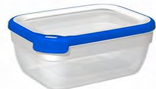
Curver Chef@home® bakje 2.5L