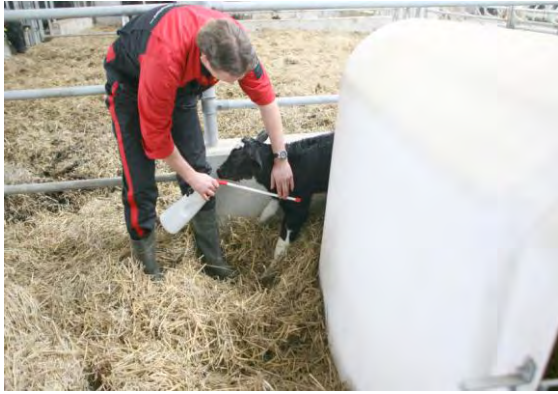
Afstand elleboog-neus bepalen = diepte inbrengen