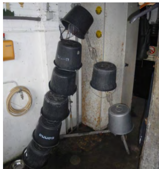
Manieren van het laten opdrogen van emmers