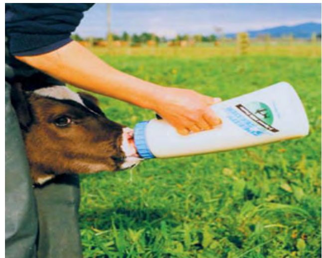
Kalf kop klemmen om vast te houden