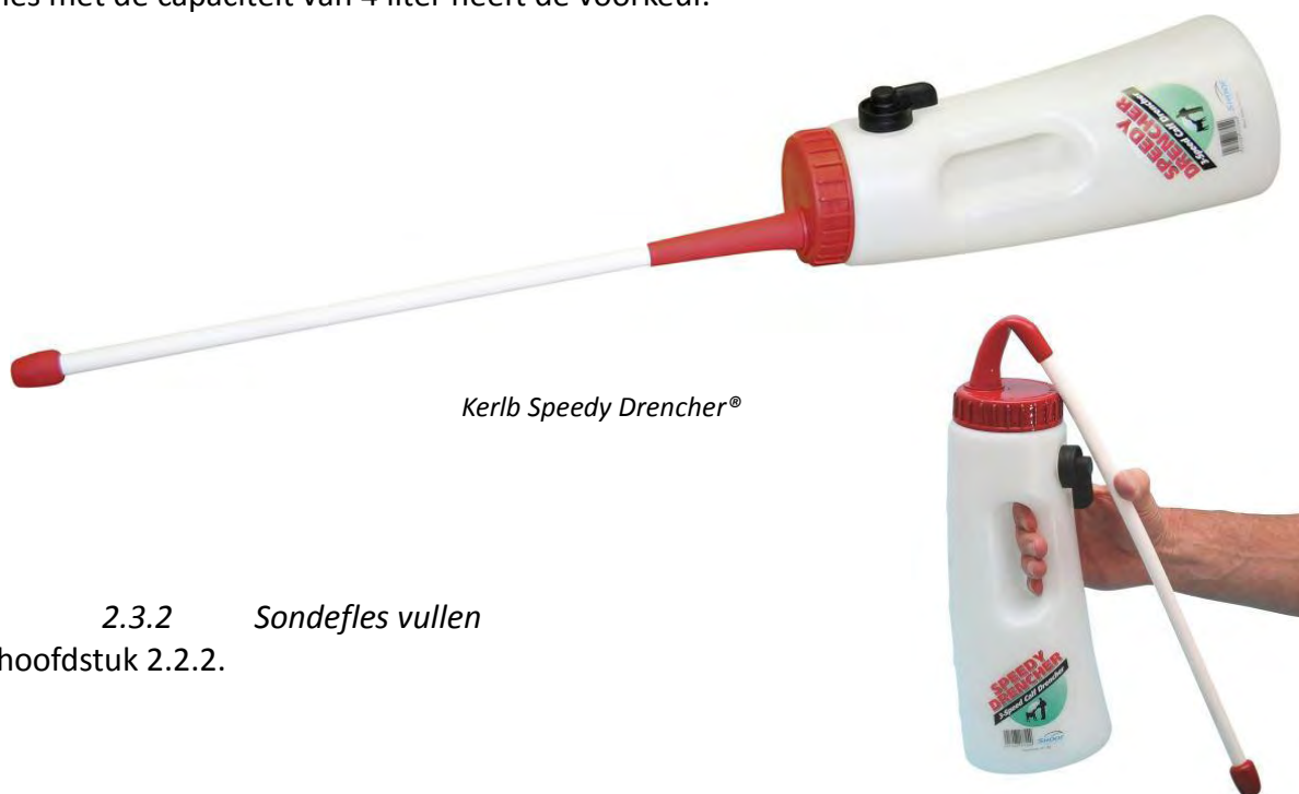
Kerlb Speedy Drencher®

De voorkeur gaat uit naar de Kerlb Speedy Drencher®, zie onderstaande foto. Deze voldoet aan bovenstaande eisen. Hij heeft daarnaast een extra voordeel dat het sonde gedeelte verwijderd en vervangen kan worden door een dop met een speen, zodat het ook kan dienen als drinkfles. Er zijn twee typen met een verschillend volume beschikbaar op de markt van respectievelijk 2,5 en 4 liter. De fles met de capaciteit van 4 liter heeft de voorkeur.