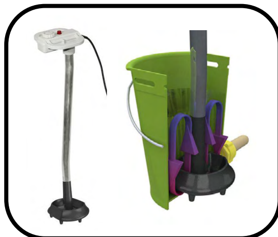
Warmte element: B (goed)