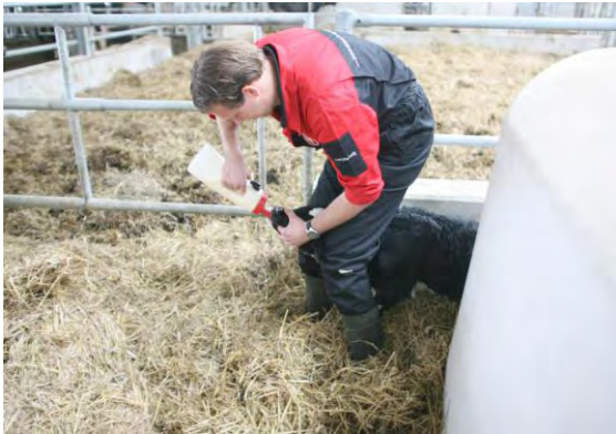
Fles leeg laten lopen in het kalf