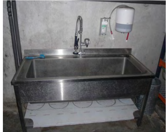
Ruime gootsteen om materiaal schoon te maken