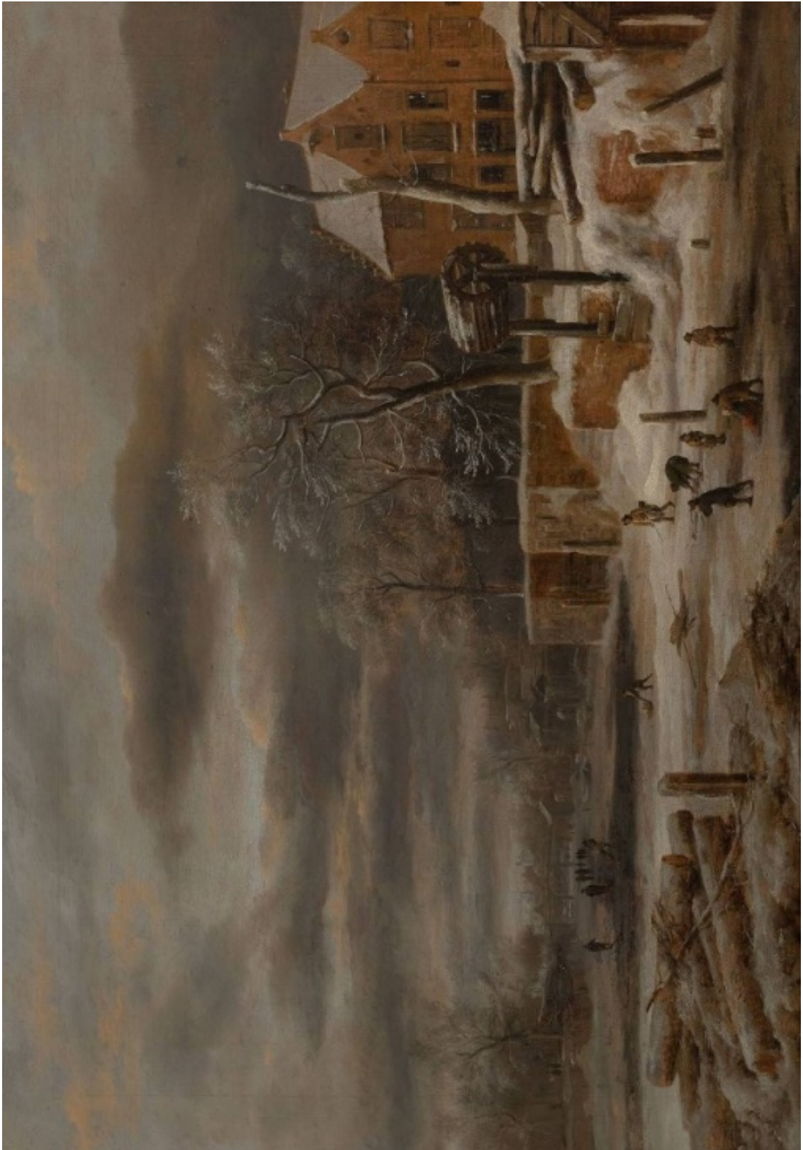
Jacob van Ruisdael, Winterlandschap , 1670