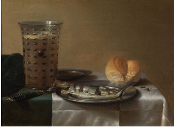
Pieter Claesz, Ontbijtje , 1636