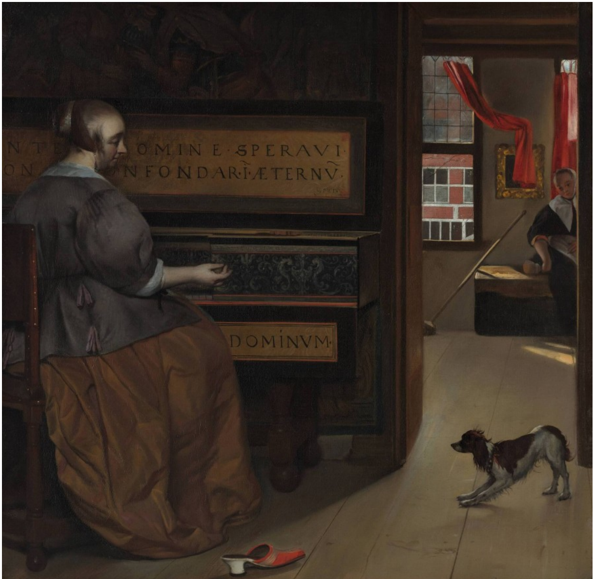
Gabriel Metsu, Vrouw aan virginaal , 1665