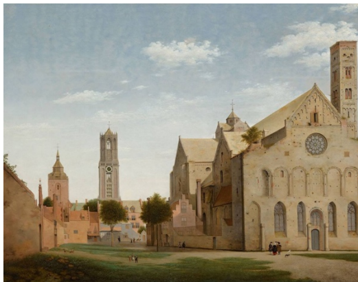
Pieter Saenredam, Gezicht op de Mariaplaats en de Mariakerk te Utrecht, 1662

Bekijk en bespreek enkele van de volgende kunstwerken. Bewaak de tijd voor de introductiefase goed.