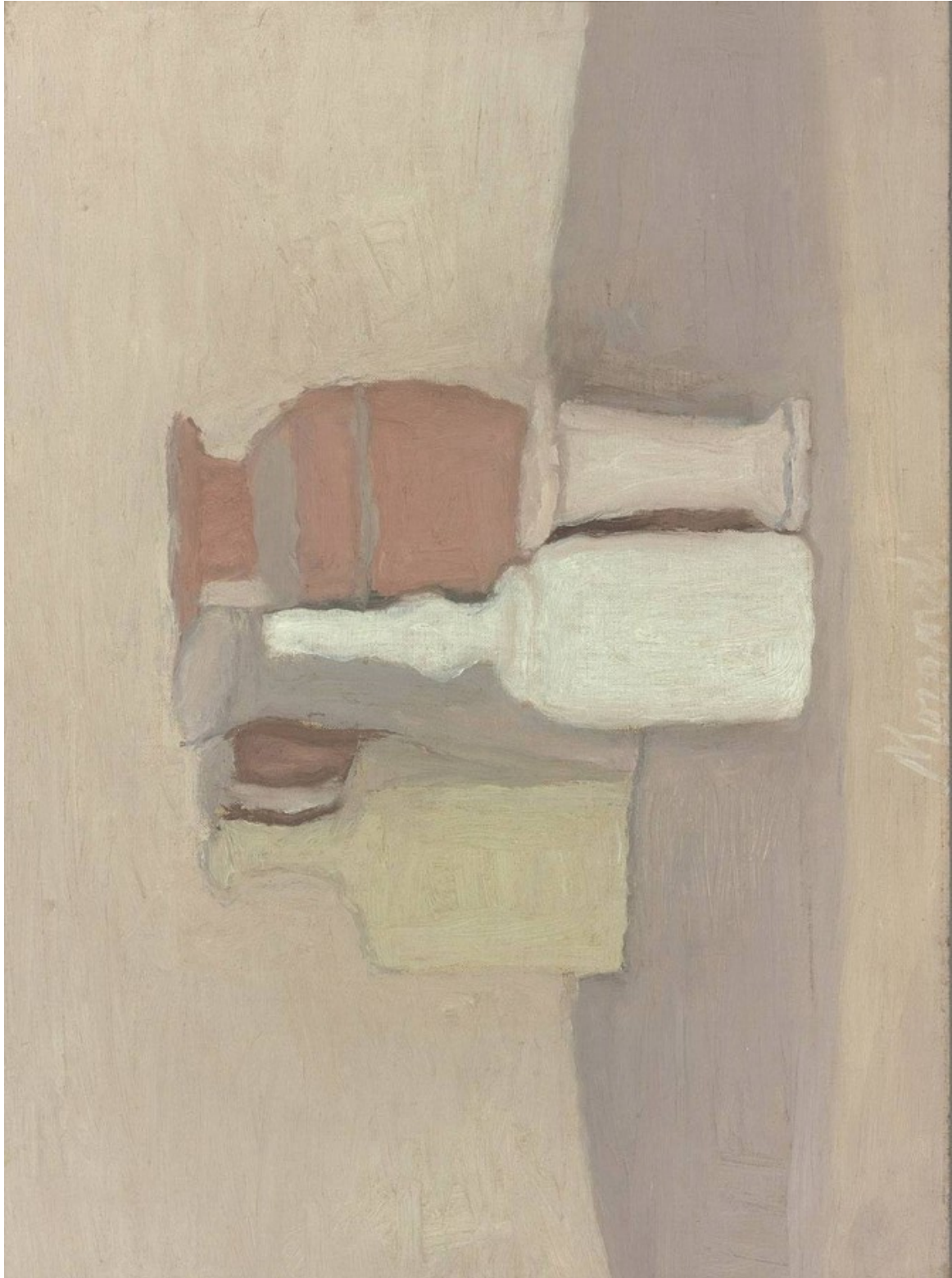
Giorgio Morandi, Natura morta , 1947-48