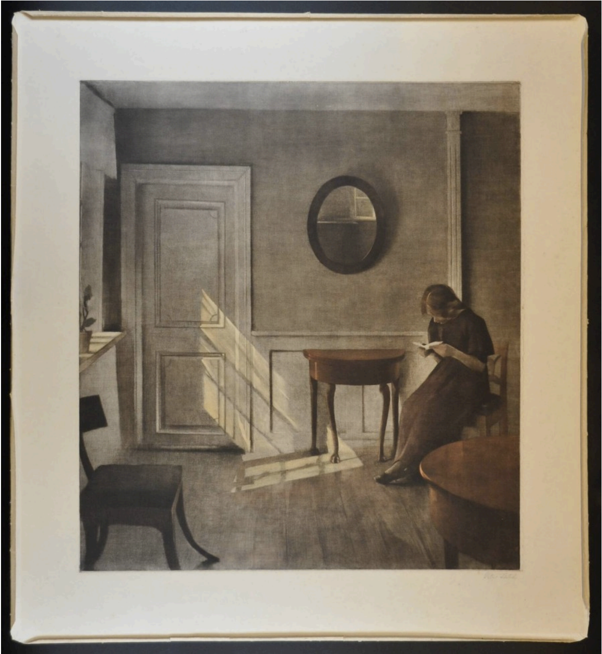
Peter Vilhelm Ilsted, De oude kamer , 1920