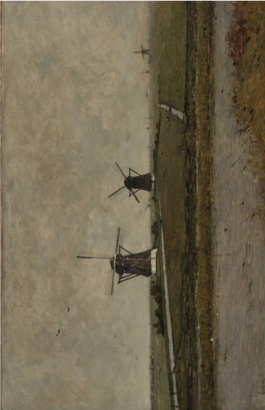
Paul Gabriel, Landschap bij Overschie , 1898