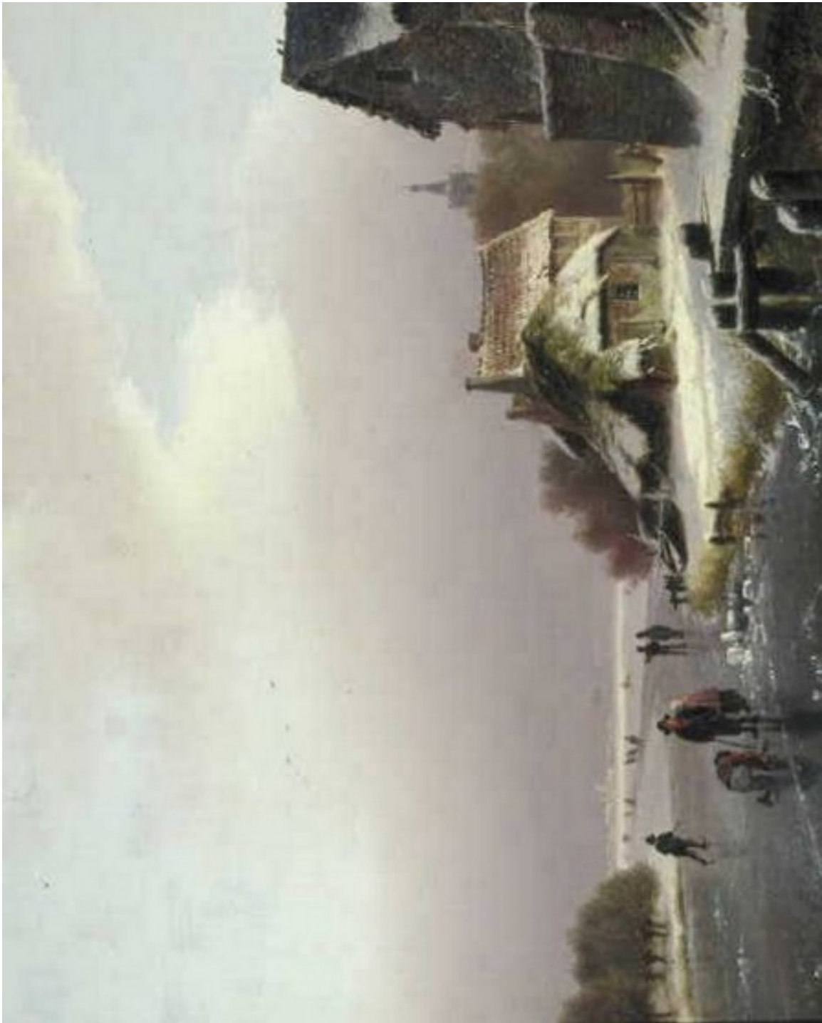
Barend Koekkoek, Winterlandschap , 1841