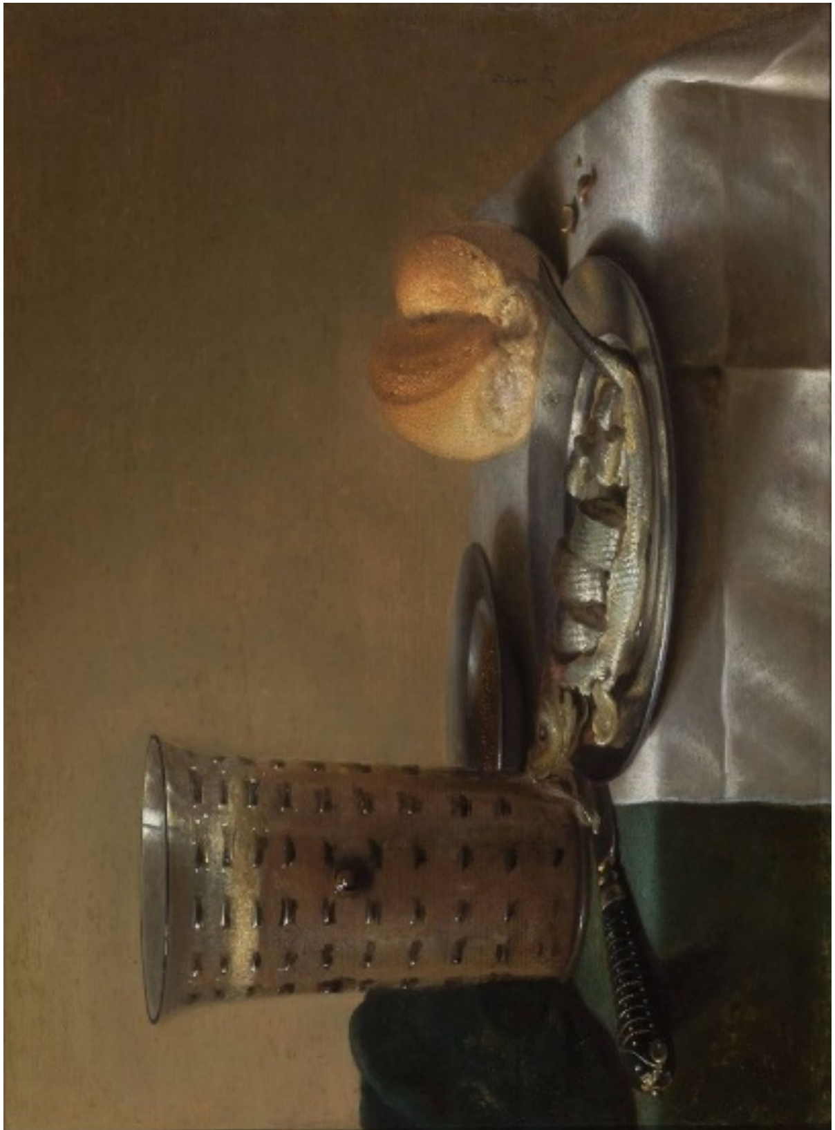
Pieter Claesz, Ontbijtje , 1636