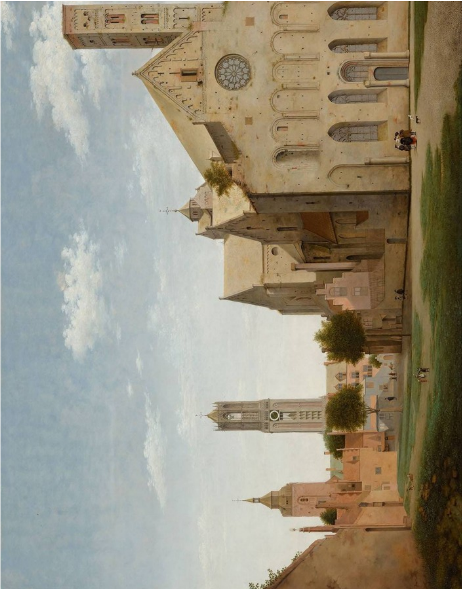
Pieter Saenredam, Gezicht op de Mariaplaats en de Mariakerk te utrecht , 1662