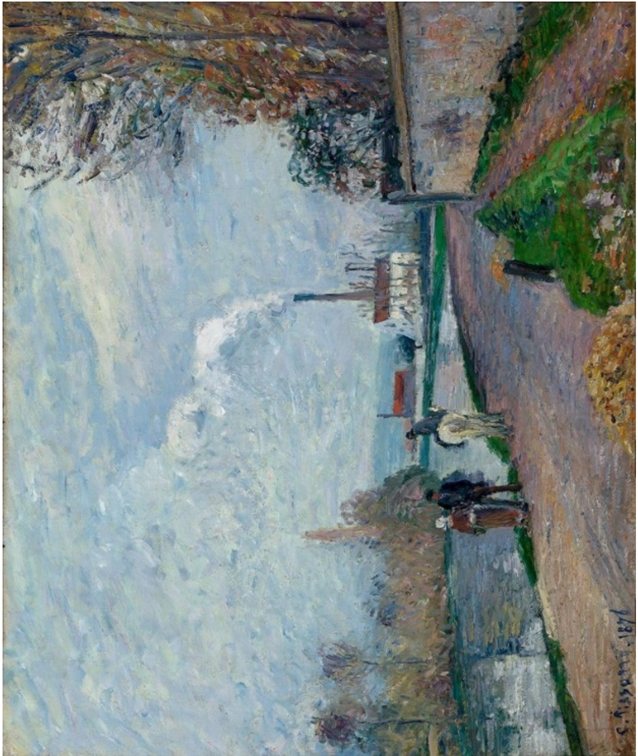
Camille Pissarro, De Oise bij Pontoise bij grijs weer , 1876