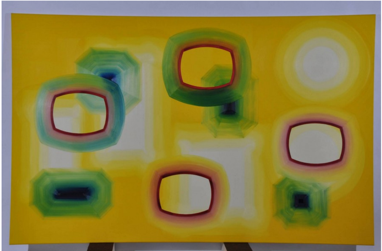
Johan van oord, Compositie 51, 1989