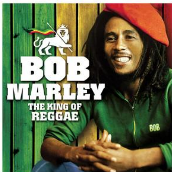
Bron 4: Bob Marley, the king of reggae

In Jamaica bijvoorbeeld heeft het toerisme bijgedragen aan het besef van de waarde van de eigen cultuur door middel van muziek, met name reggae. Reggae, met zijn wortels diep geworteld in Jamaicaanse tradities en geschiedenis, heeft wereldwijde bekendheid gekregen dankzij toeristen die naar het eiland komen om te genieten van de muziekcène. Het toerisme heeft zo in Jamaica geleid tot een grotere waardering voor de eigen lokale cultuur.