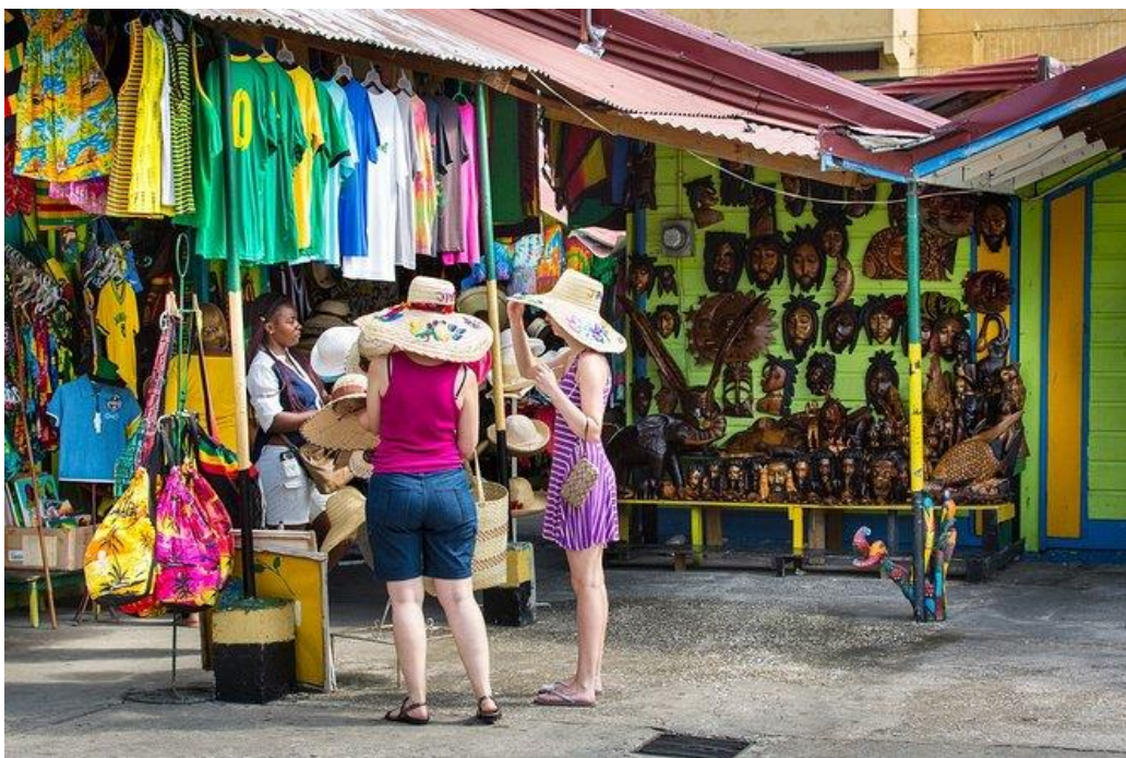
Bron 5: Montego Bay – shopping tour

Bijvoorbeeld in populaire toeristische gebieden zoals Montego Bay in Jamaica hebben de toeristenindustrie en de vraag naar traditionele Jamaicaanse cultuur geleid tot culturele commercialisering. De lokale bewoners is min of meer gedwongen om hun culturele erfgoed aan te passen aan de verwachtingen van toeristen. Dit kan resulteren in activiteiten zoals "fake" Jamaicaanse dans- en muziekvoorstellingen die zijn ontworpen om te voldoen aan stereotypen en verwachtingen van toeristen, maar weinig te maken hebben met de authentieke lokale cultuur. Bovendien kunnen sommige lokale ambachtslieden en verkopers hun traditionele ambachten en producten aanpassen om beter te passen bij de smaak en voorkeuren van toeristen, ten koste van de authenticiteit van hun ambachtelijke tradities.