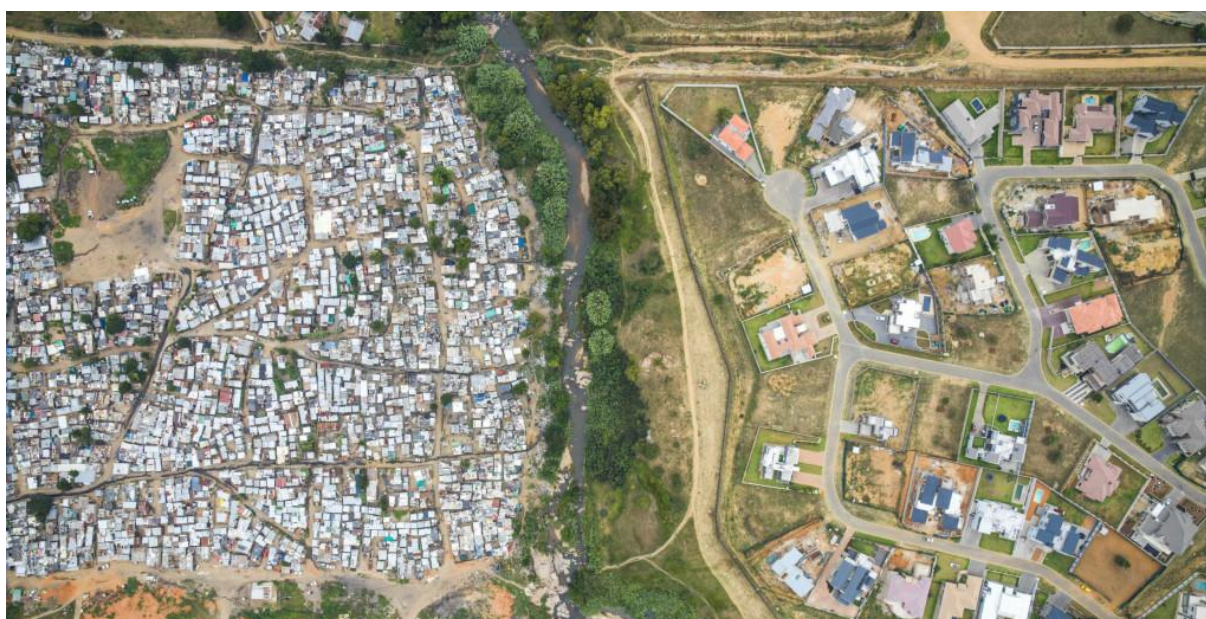
Bron 11: Ruimtelijke segregatie in beeld

In veel grote steden is er sprake van ruimtelijke segregatie. Ook in bijvoorbeeld Willemstad, met naar schatting 150.000 inwoners. In wijken die minder goed bekend staan door de ligging, vanwege de vervuiling van industrie en kwaliteit van huizen wonen mensen met een lagere sociaaleconomische positie. In een wijk als Kanga-Dein wonen bijvoorbeeld veel arme migranten uit Haïti. Terwijl er in de wijk Spaanse Water zich veel relatief rijke 'Europese' Nederlanders of welgestelde Venezolanen vestigen.