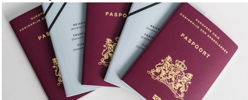
Figuur 8: Mensen die Nederlander worden kunnen een paspoort aanvragen

3. Hieronder staat een afbeelding met onderschrift. Welk begrip uit dit katern past hier het beste bij.