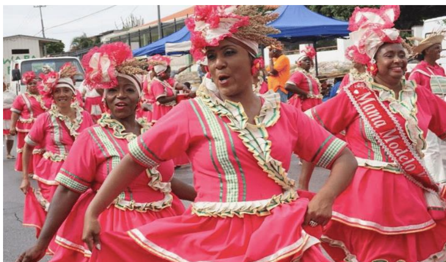
Siman di Kultura in teken van landbouw

Siman di Kultura is een mooi voorbeeld waarbij aandacht kan worden gegeven aan al die verschillende culturen en nationaliteiten van mensen die op het eiland leven en kan zorgen voor verbondenheid.