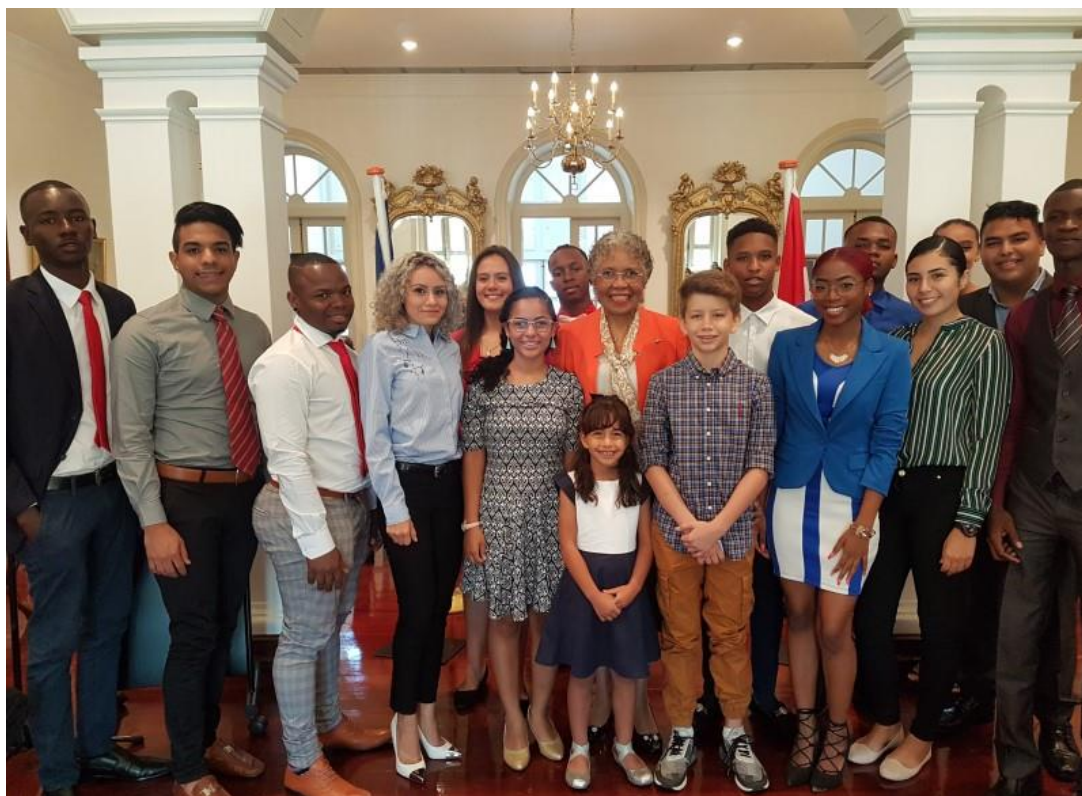
Bron 7: Naturalisatieceremonie op Curaçao.

migranten ten minste een aantal jaren onafgebroken en legaal op Curaçao wonen. Ze moeten een inburgeringsexamen doen en voldoende kennis hebben van de samenleving en de Nederlandse taal. Eenmaal genaturaliseerd krijg je een Nederlands paspoort waardoor je helemaal vrij bent om te reizen, te werken en te wonen binnen het Koninkrijk, maar ook bijvoorbeeld binnen de EU. Spaanstaligen migranten kunnen bijvoorbeeld het Nederlanderschap gebruiken om zich vervolgens in Spanje te vestigen.