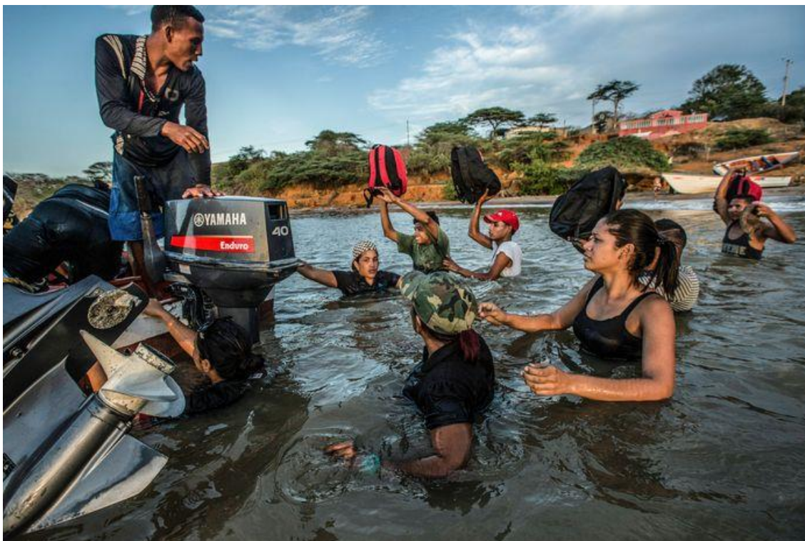
Bron 6: Migranten uit Venezuela klimmen aan boord van een smokkelaar, die hen naar Curaçao brengt.

Dat er ook de laatste tientallen jaren sprake was van immigratie kun je goed zien als je kijkt naar het geboorteland van de inwoners van Curaçao. Op een totale bevolking van 150.000 mensen zijn er 36.000 mensen in een ander land geboren. Daarnaast wonen er 27.000 mensen in Curaçao die behoren tot de tweede generatie. Dat zijn kinderen die zelf geboren zijn in Curaçao, maar waarvan de ouders migranten waren (cijfers van 2011).