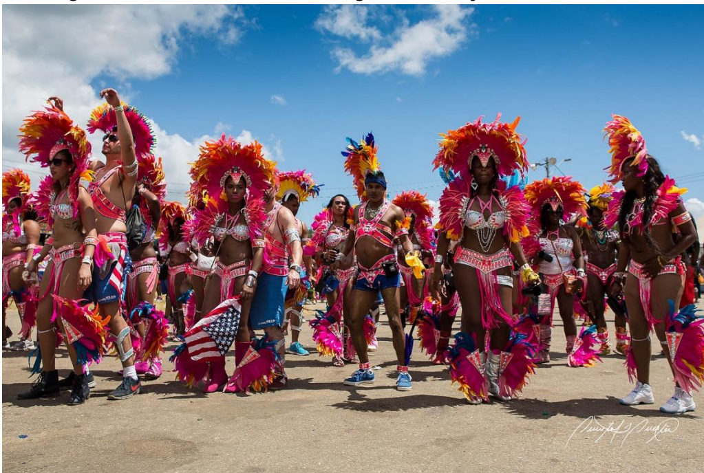
Bron 3: Carnaval Trinidad en Tobago

Daarnaast heeft ieder eiland een rijke en unieke culturele en historische achtergrond, beïnvloed door een mix van inheemse, Afrikaanse, Europese, en Aziatische invloeden. Dit komt tot uiting in de muziek, dans, kunst, en festivals. Zo is het Trinidad en Tobago's carnaval wereldberoemd. Het feest weerspiegelt de diverse culturele invloeden van het eiland en staat bekend om zijn levendige muziek en de vaak weelderige en kleurrijke kostuums.