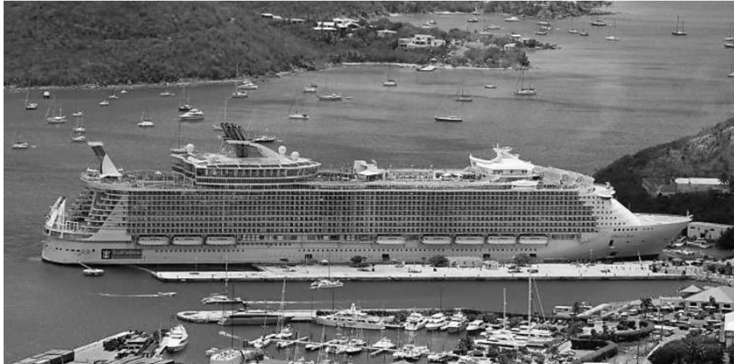
De Oasis of the Seas, een cruiseschip van Royal Caribbean

vrij naar: http://nos.nl/artikel/645928-megacruiseschip-voor-de-caraiben.html