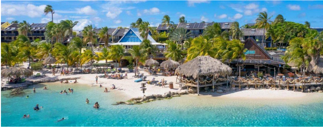
Afbeelding: Hotels en appartementen in Curaçao.