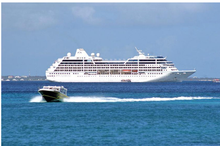
Bron 6: Cruisetoerisme

Cruisetoerisme: Dit omvat toeristen die reizen aan boord van een cruiseschip. Ze brengen een beperkte tijd door op verschillende bestemmingen en hun uitgaven op het land zijn vaak lager dan die van stay-over toeristen. Zie bron 6.