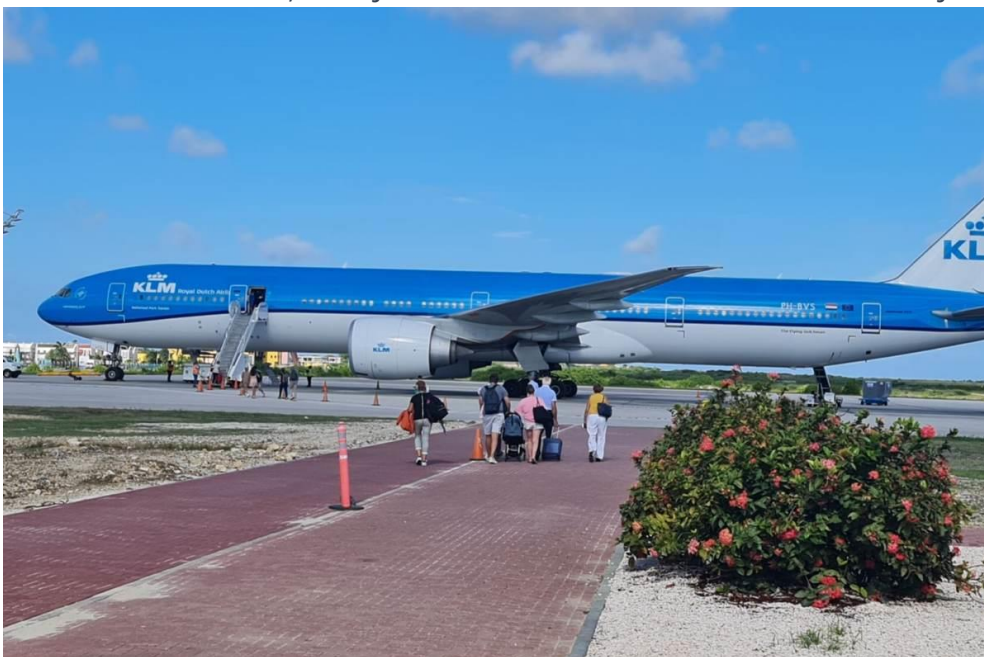
Bron 5: KLM in Bonaire

De eilanden zijn natuurlijk wel door water gescheiden van het vasteland en andere eilanden, wat de bereikbaarheid voor toeristen bemoeilijkt en duurder maakt. Maar ontwikkelingen in de luchtvaartsector hebben geleid tot een korte reisduur en goedkopere vluchten naar de eilanden; de relatieve afstand naar de eilanden is kleiner geworden. Veel grote steden in de Verenigde Staten bieden bijvoorbeeld directe vluchten naar de Bahama's, Cuba, Puerto Rico, Dominicaanse Republiek, Barbados en/of Jamaica. Vanuit Londen zijn er directe vluchten naar Barbados en Jamaica, terwijl er vanuit Amsterdam directe vluchten zijn naar Curaçao en Aruba.