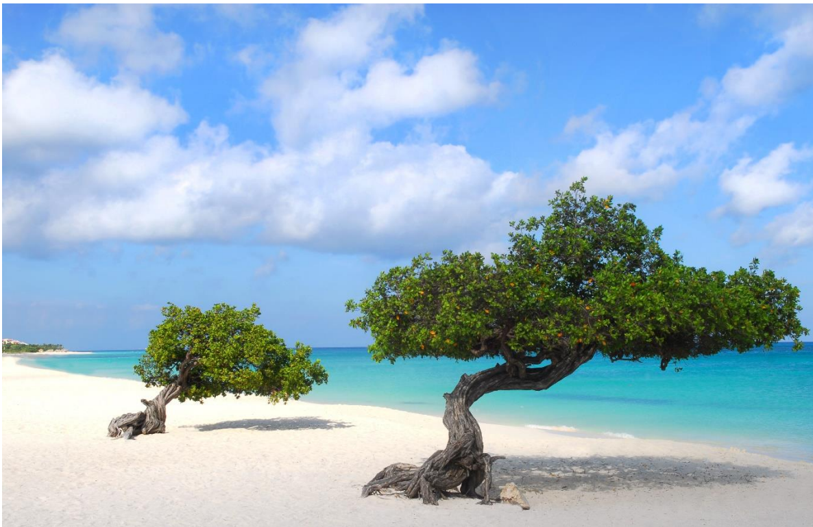
Bron 1: Eagle Beach

De regio staat bekend om zijn prachtige stranden met fijn, wit zand en helderblauwe wateren. Deze stranden zijn ideaal voor zonnebaden, zwemmen, en diverse watersporten zoals snorkelen, duiken, en zeilen. Er heerst een tropisch klimaat met het hele jaar door warm weer, wat het gebied aantrekkelijk maakt voor toeristen uit koudere klimaten. Zo is het adembenemend mooie Eagle Beach op Aruba met zijn uitgestrekte zandvlaktes en heldere water, in combinatie met het tropische klimaat en de vele strandbars en restaurants, het hele jaar door een geweldige bestemming.