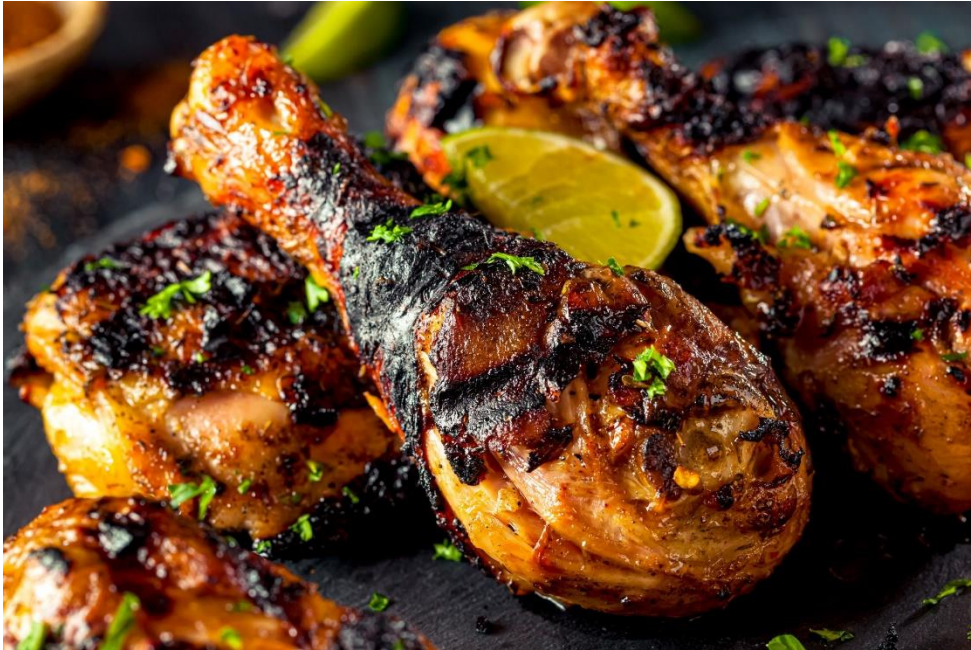
Bron 4: Jerk Chicken

Europese invloeden weerspiegelt. Het gerecht is vooral populair in Jamaica, maar je vindt het in vele variaties door het hele Caribische gebied.