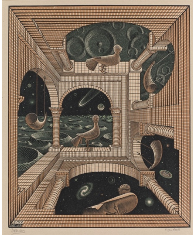
M.C. Escher, Andere werelden, 1947