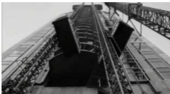
Karel Doing, Images of a moving city, 2005

Niet alleen kunstschilders creëerden vervreemdende effecten, ook fotografen passen dit veelvuldig toe om de toeschouwer op het verkeerde been te zetten of een nieuwe werkelijkheid te creëren. In volgende afbeeldingen is te zien hoe fotografen spelen met het standpunt.