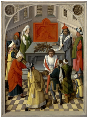
Meester van de Inzameling van het Manna, Offerande der joden, 1460 – 1470

Bekijk en bespreek vervolgens een aantal van de hieronder gepresenteerde kunstwerken. Bewaak de tijd voor de introductie goed.