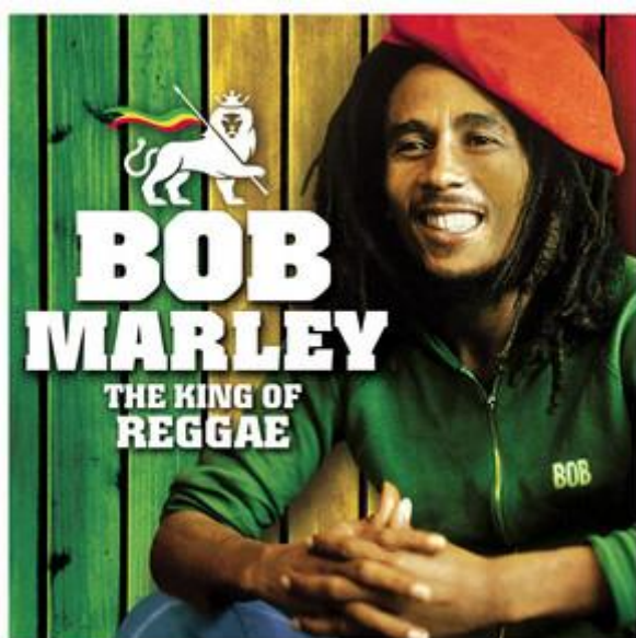
Bron 4: Bob Marley, the king of reggae

In Jamaica bijvoorbeeld heeft het toerisme bijgedragen aan het besef van de waarde van de eigen cultuur door middel van muziek, met name reggae. Reggae, met zijn wortels diep geworteld in Jamaicaanse tradities en geschiedenis, heeft wereldwijde bekendheid gekregen dankzij toeristen die naar het eiland komen om te genieten van de muziekcène. Het toerisme heeft zo in Jamaica geleid tot een grotere waardering voor de eigen lokale cultuur.