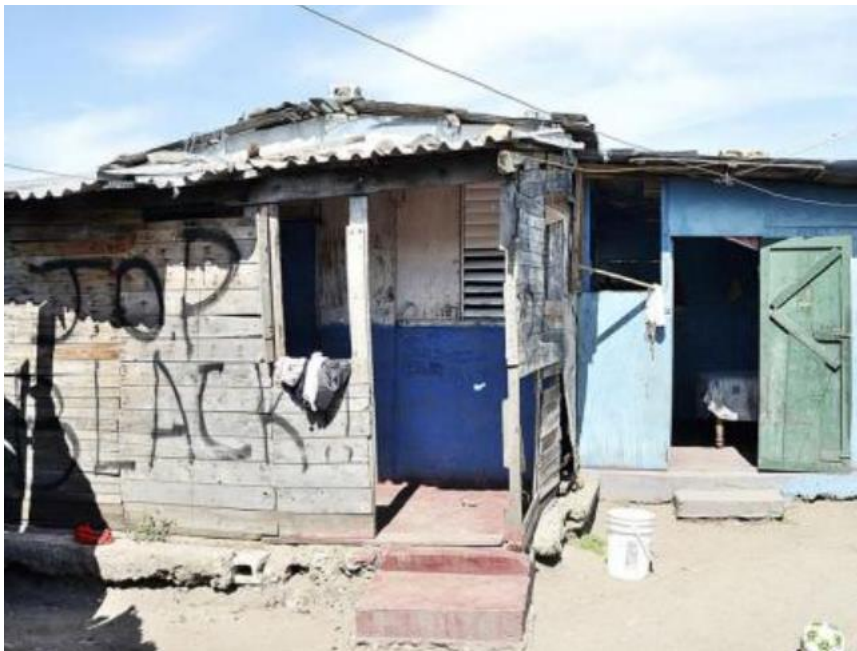
Bron 15: Squatter settlements in Jamaica

Een ander voorbeeld is te zien in landen zoals Jamaica, waar informele nederzettingen, ook bekend als "squatter settlements", worden gebouwd door de bewoners zelf. Deze nederzettingen bestaan uit huizen die zijn opgetrokken uit materialen zoals hout, golfplaten en karton, en worden vaak gebouwd zonder de formele goedkeuring van de overheid.