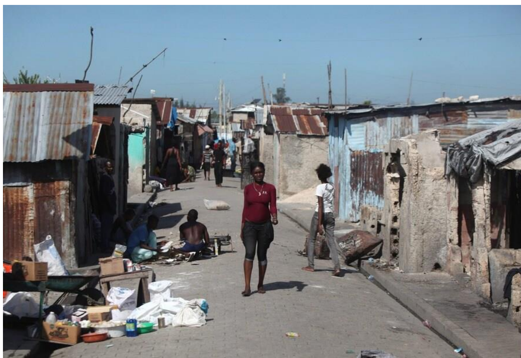
Bron 14: Krottenwijk Cité Soleil in Port-au-Prince – Haïti

In arme landen zijn zelfbouwwijken vaak sloppen- of krottenwijken in de buurt van grote steden. De bewoners van de krottenwijk hebben veelal hun eigen armoedige 'krot' gebouwd omdat er te weinig betaalbare woningen zijn. De bewoners van de sloppenwijken zijn vaak niet geregistreerd en het ontbreekt ze aan de meest basale voorzieningen, zoals schoon water, een veilig onderkomen, inkomen. Wereldwijd wonen er meer dan één miljard mensen in zo'n zelfbouwwijk.