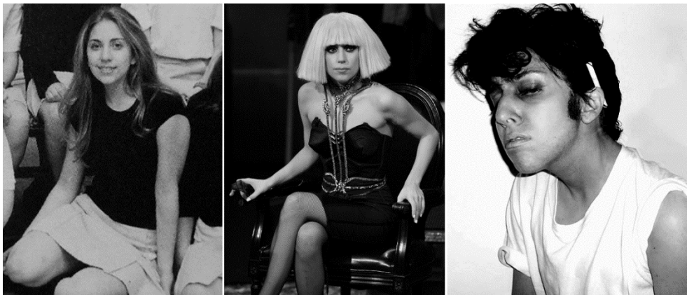
Germanotta als zichzelf, als Lady Gaga en als Jo Calderone

Tijdens een show in 2011 verscheen Germanotta opeens niet als Lady Gaga, maar als een mannelijk alter ego genaamd Jo Calderone.