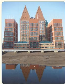
1 Op het ministerie wordt een nieuwe wet bedacht.