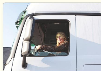
4 De minister zorgt ervoor dat de wet uitgevoerd wordt.