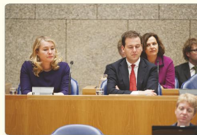
2 De minister dient een wetsvoorstel in bij het parlement.