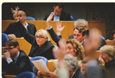
3 Het parlement stemt over het wetsvoorstel.