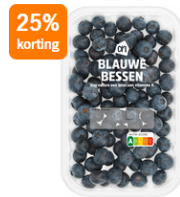
AH Blauwe bessen Bijv. 150 gram

Vaak wordt 50% herkend als 'de helft van', geldt dat ook voor de cursist? Herkent die dan ook 25% als de helft van de helft? 10% is bij sommigen ook bekend als 'delen door 10' of de komma opschuiven'. Als de cursist dat kan kun je onderstaand plaatje met kortingen gebruiken om de cursist met een zelf gekozen bedrag de korting te laten schatten of berekenen.