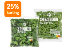
AH Spinazie of sperziebonen 400 gram Bijv. spinazie - Per zak