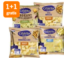
Alle CéléVita Bijv. minikrullijtes - 2 zakken à 450 ...