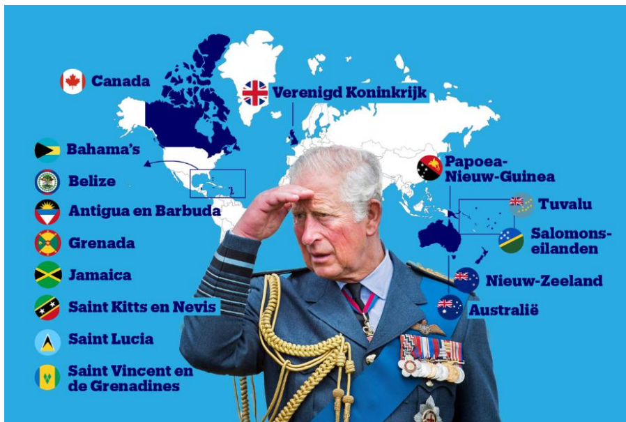
Bron 9: Koning Charles staatshoofd van meerdere landen in het Caribisch gebied