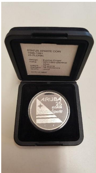
Bron 6: Munt ter gelegenheid van 25 jaar status aparte van Aruba.

Het verwerven van de status aparte van Aruba in 1986 ging gepaard met een groeiend nationalistisch bewustzijn op Aruba. Dit werd gesymboliseerd door de creatie van een eigen vlag (zie bron 5) en volkslied. De eigen vlag en het volkslied benadrukken de unieke identiteit en cultuur van het eiland. Deze symbolen dienden als een bron van trots en eenheid voor de Arubaanse bevolking. Nog elk jaar is er een feestdag om de onafhankelijkheid te vieren op 18 maart. Op 18 maart 1948 werd er een officieel verzoek ingediend voor afscheiding van Aruba van de Nederlandse Antillen. Deze dag staat bekend als dag van Volkslied en Vlag (Himno y Bandera). In bron 6 zie je een munt die 25 jaar na de status aparte werd uitgebracht als herinneringsmunt.