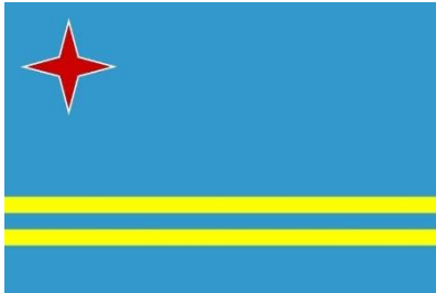
Bron 5: Vlag Aruba

Het verwerven van de status aparte van Aruba in 1986 ging gepaard met een groeiend nationalistisch bewustzijn op Aruba. Dit werd gesymboliseerd door de creatie van een eigen vlag (zie bron 5) en volkslied. De eigen vlag en het volkslied benadrukken de unieke identiteit en cultuur van het eiland. Deze symbolen dienden als een bron van trots en eenheid voor de Arubaanse bevolking. Nog elk jaar is er een feestdag om de onafhankelijkheid te vieren op 18 maart. Op 18 maart 1948 werd er een officieel verzoek ingediend voor afscheiding van Aruba van de Nederlandse Antillen. Deze dag staat bekend als dag van Volkslied en Vlag (Himno y Bandera). In bron 6 zie je een munt die 25 jaar na de status aparte werd uitgebracht als herinneringsmunt.