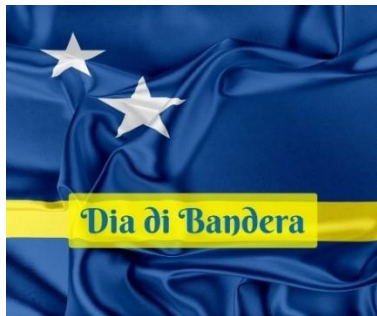
Bron 7: Dag van de vlag

muziek, kunst, festivals, zoals het jaarlijkse carnaval en feestdagen. Wel moet worden opgemerkt dat elk eiland zijn eigen unieke karakter heeft. Bijvoorbeeld, het lokale bewustzijn op Bonaire, met zijn rijke natuurlijke schoonheid en duiklocaties, verschilt van dat van het kosmopolitische, wereldse Curaçao. Dit regionale bewustzijn wordt versterkt door lokale tradities, dialecten, evenementen en feestdagen die specifiek zijn voor elk eiland. Denk bijvoorbeeld aan 'Dia di Bandera' op Bonaire en Curaçao (zie bron 7) en 'Dia di Betico Croes' op Aruba.