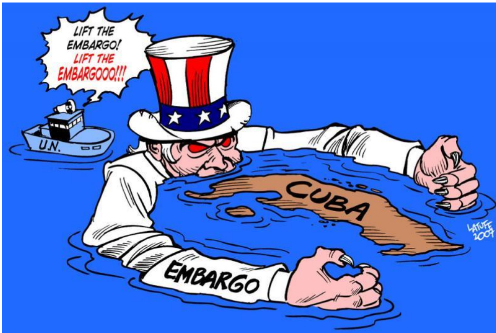
Bron 10: De Verenigde Staten stelden een embargo in tegen Cuba.