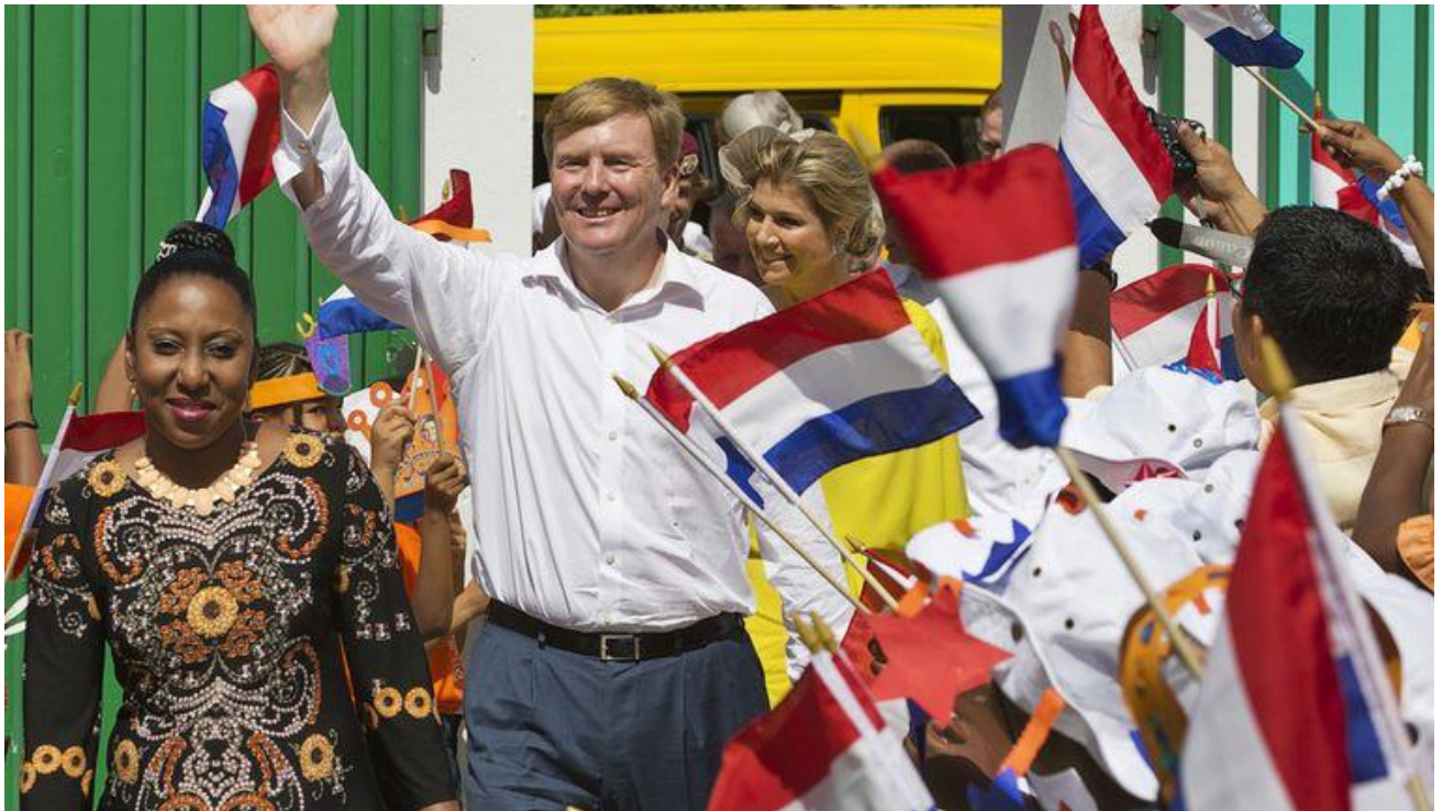
Koning Willem Alexander en koningin Maxima bezoeken het Caribisch deel van het Koninkrijk der Nederlanden