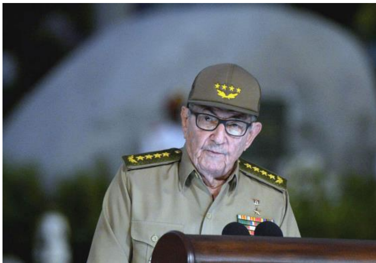
Raúl Castro bij de viering van het jubileum van de Cubaanse revolutie

september 2019 - De voorzitter van de Cubaanse Communistische Partij Raúl Castro mag het grondgebied van de Verenigde Staten niet meer betreden. Dat heeft de Amerikaanse minister van Buitenlandse Zaken bekendgemaakt. Castro is de broer van Fidel Castro, degene die de republiek Cuba omvormde tot een communistische staat. Raúl Castro oefent veel invloed uit op politieke en militaire beslissingen van Cuba. Volgens de minister heeft Castro mensenrechten geschonden door het regime van de Venezolaanse president Nicolás Maduro te steunen. Ook de directe familieleden van Castro kunnen de Verenigde Staten niet meer betreden of hebben grote kans uitgeleverd te worden aan de Verenigde Staten als ze een gebied betreden waar de Verenigde Staten veel invloed op heeft. Volgens de Verenigde Staten is Castro indirect verantwoordelijk voor het geweld, intimidatie en de onderdrukking door het regime-Maduro. Met de sanctie willen de Verenigde Staten vooral dat Cuba stopt met het steunen van Maduro. In de zomer van 2019 besloten de Verenigde Staten al het zee-cruisetoerisme naar Cuba te stoppen.