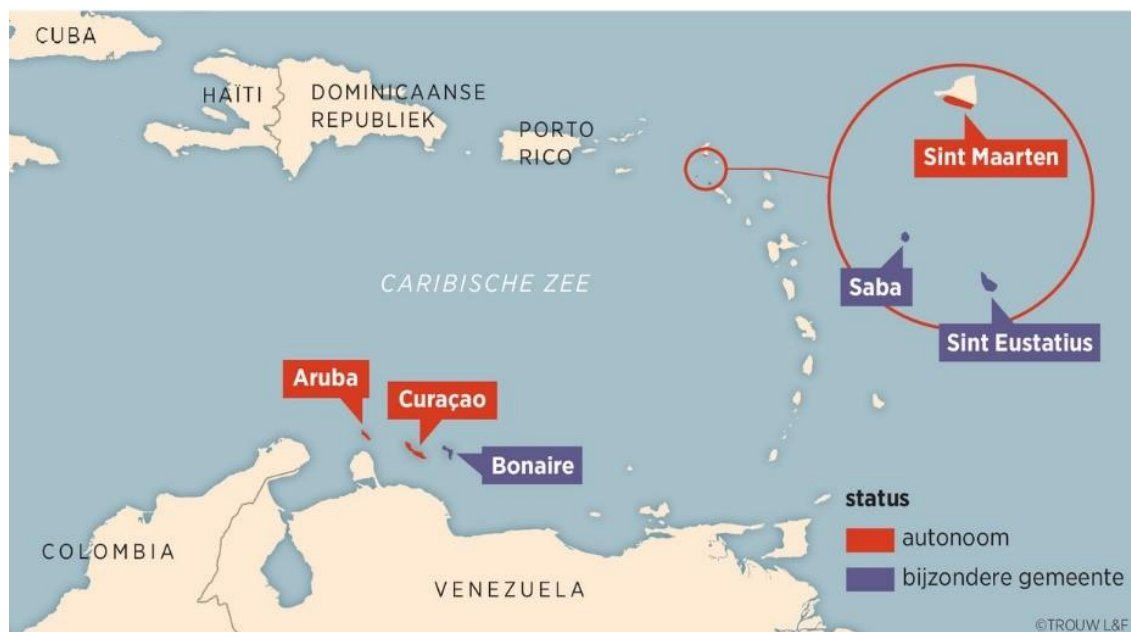
Bron 1: De ligging van de BES-eilanden (blauw) en de CAS-eilanden (rood)

De BES-eilanden hebben ondanks hun geografische afstand van het Europese vasteland, een unieke status als 'Caribische bijzondere gemeenten' (officieel: openbare lichamen) gekregen. Deze status plaatst de eilanden in een interessante positie: ze zijn geen onafhankelijke landen, maar ook geen traditionele gemeenten. Ze hebben een hybride positie, wat betekent dat ze nauw verbonden zijn met het Nederlandse staatsbestel (regeringsvorm), maar met bepaalde lokale aanpassingen aan hun specifieke behoeften en omstandigheden. De drie eilanden liggen niet binnen het grondgebied van de Europese Unie (EU), maar de inwoners bezitten wel de rechten van het EU-burgerschap.