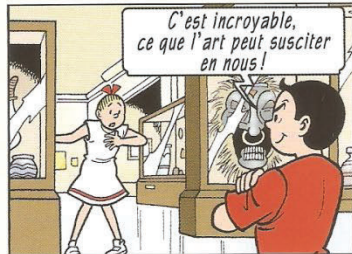
Toch ongelooflijk wat kunst bij iemand kan losmaken!