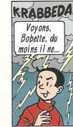
Ach Wiske, wees blij dat het niet...