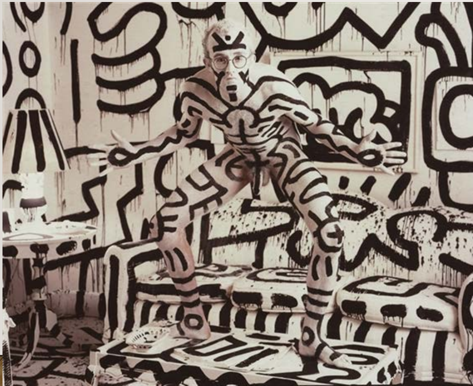
'Keith Haring', Annie Leibovitz (1986)