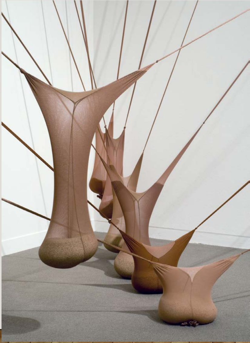
'Unknown', Eva Hesse, (1936-1970)