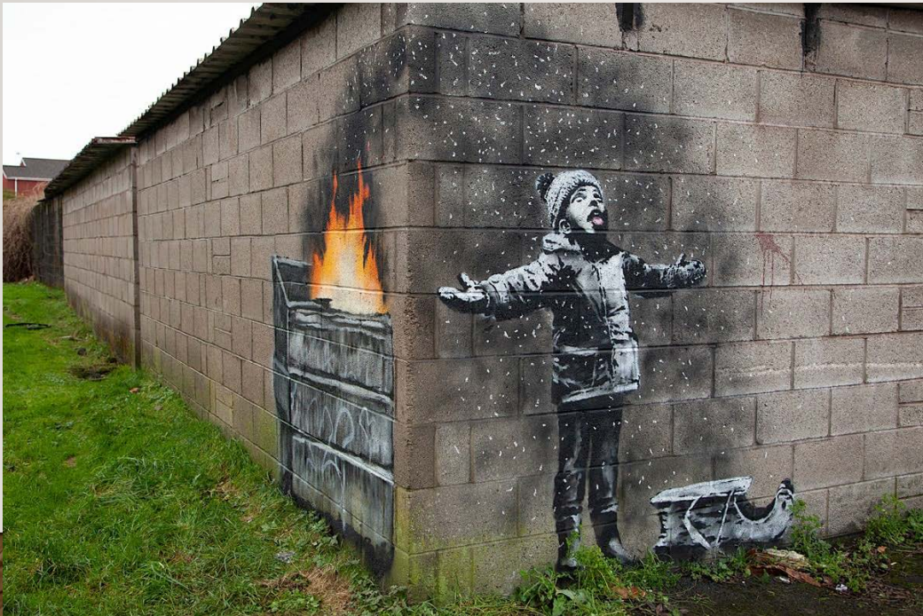
Unkown, Banksy, (v.a. 1990-heden)