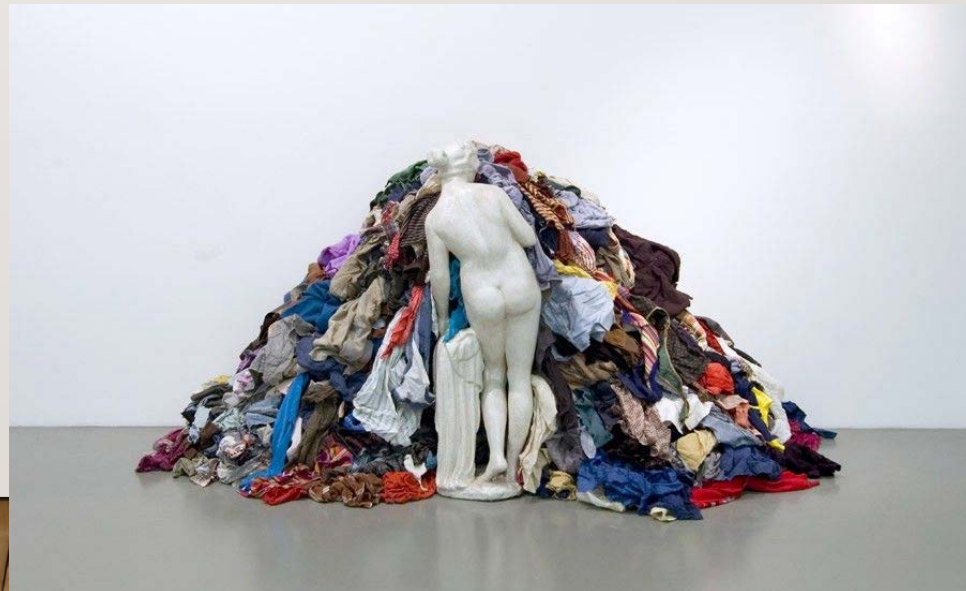
'Venus of the Rags', Michelangelo Pistoletto, (1967)