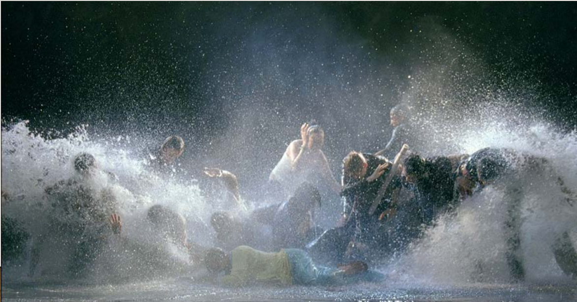
'The Raft, Bill Viola, (2004)