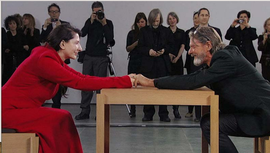
'The Artist is Present', Marina Abramovic, (2010)