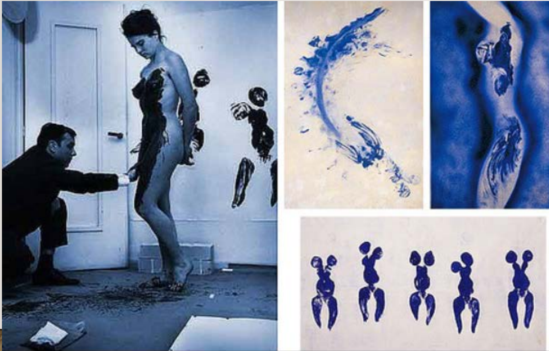
'Blue Woman Art', Yves Klein, (1962)