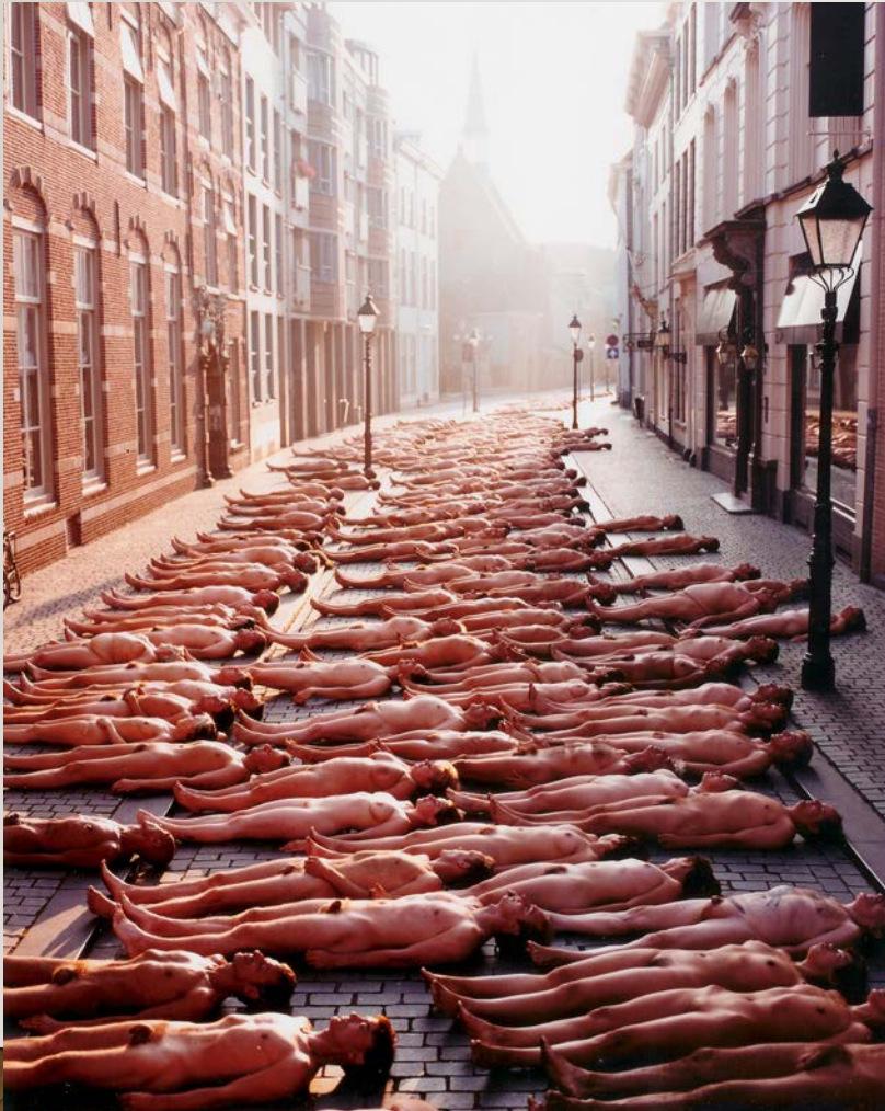
'Fotoserie Breda', Spencer Tunick, (2001)