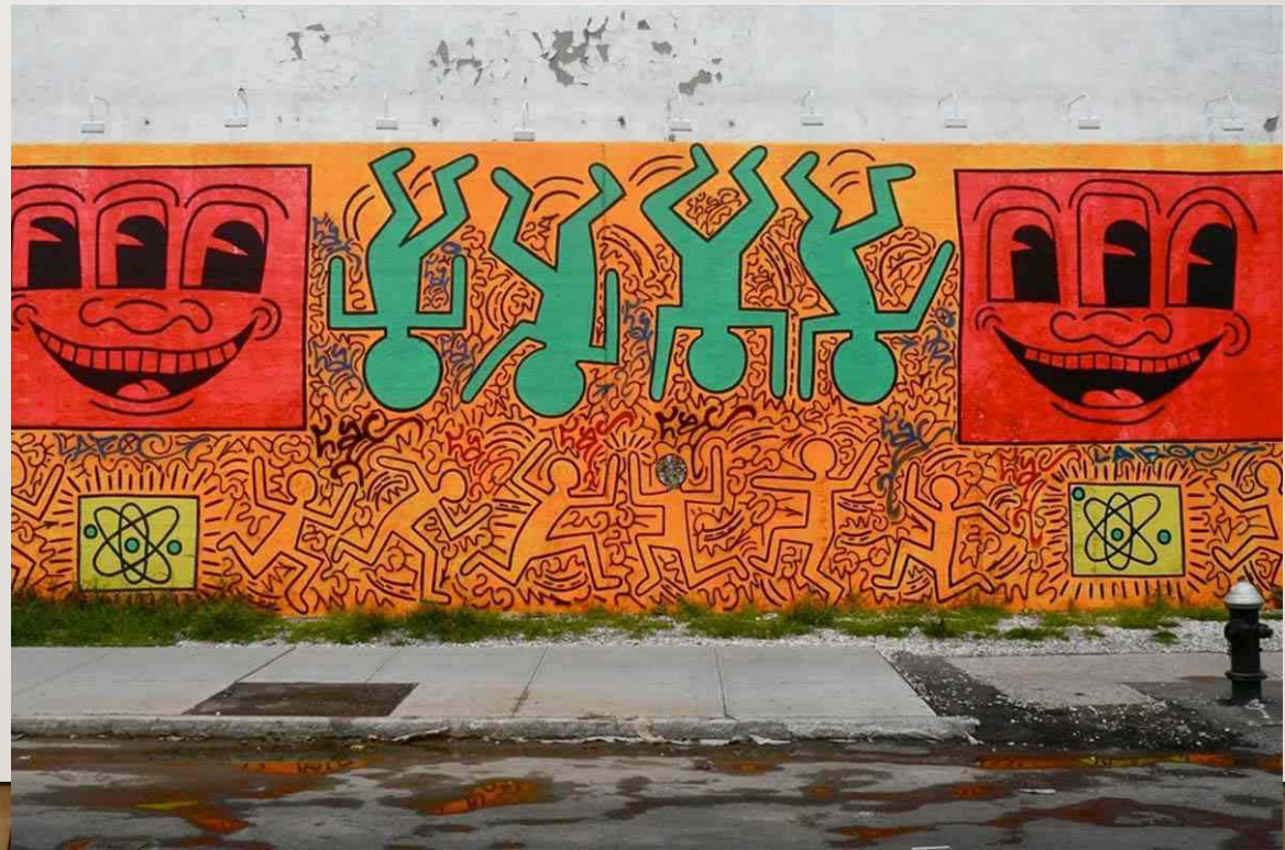
Houston Bowery Wall, Keith Haring (1982)