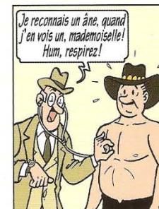
Je reconnais un âne, quand j'en vois un, mademoiselle! Hum, respirez! Ik weet hoe een ezel eruitziet, juffrouw! Hm, ademen.