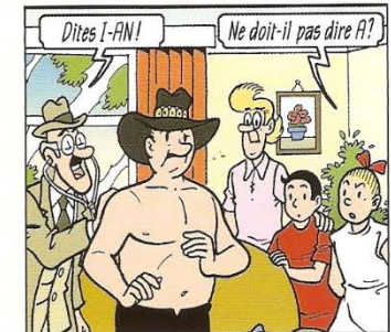
Dites I-AN! Ne doit-il pas dire A? - Zeg eens I-AN! - Is het niet gewoon A?