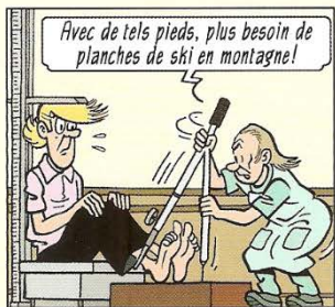
Avec de tels pieds, plus besoin de planches de ski en montagne! Met zulke voeten hebt u op wintersport vast geen skilatten meer nodig!