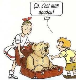
Dat is mijn troetelbeest!