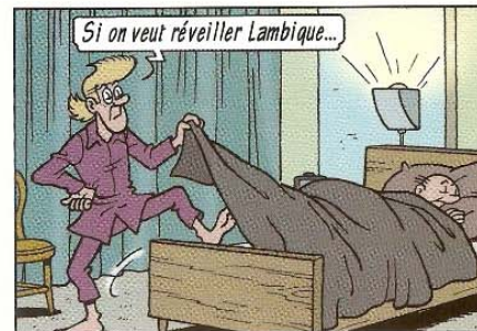
Als je Lambik wakker wilt maken...

het slapengaan gaan slapen / gaan liggen een kusje een pyjama tanden poetsen een tandenborstel de tandpasta zich wassen washandje de zeep kammen een kam