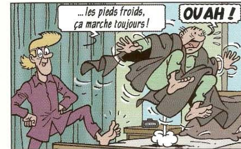
...werken koude voeten altijd! WOEH!