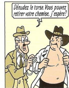
Dénudez le torse. Vous pouvez retirer votre chemise, j'espère! Ontbloot uw borst eens. Krijgt u uw hemd nog uit?