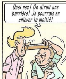
Quel nez! On dirait une barrière! Je pourrais en enlever la moitié! Wat een neus! Net een slagboom! Daar mag zeker de helft af!