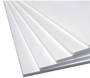
Figuur 2: Foamboard