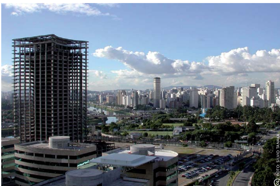
Zicht op het centrum van São Paulo vanuit Vila Olimpia, een multifunctioneel subcentrum met een groot winkelaanbod, kantoren, lichte industrie en luxe appartementen.

Gerekend vanuit het historisch stadscentrum (Casco Histórico) verdelen we MMC met cirkels in vier gebieden, op toenemende afstand van dat centrum. Bijna 70% van de formele werkgelegenheid in MMC bevindt zich in binnenste twee ringen met zeventien subcentra, die goeddeels wordt omsloten door het circuito interior . Verreweg het grootste subcentrum in MMC is het Casco Histórico zelf, met bijna