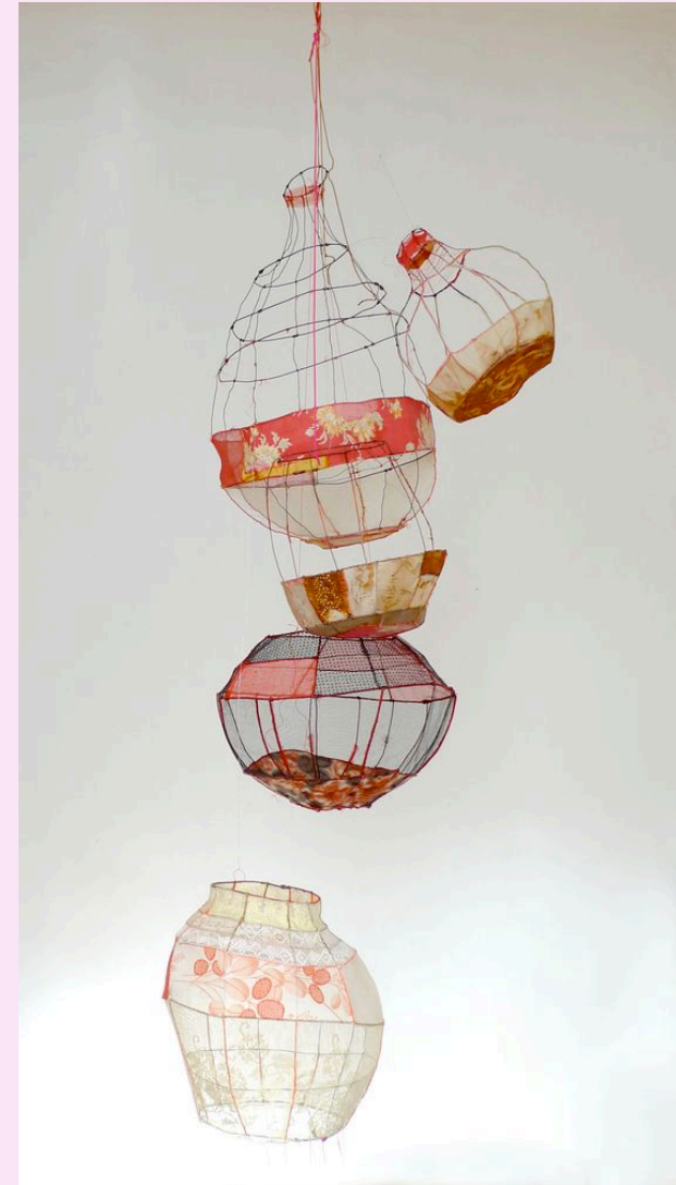
Sylvia Eustache Rools