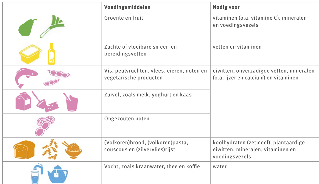
▼ Afb. 47 De vakken van de schijf van vijf.