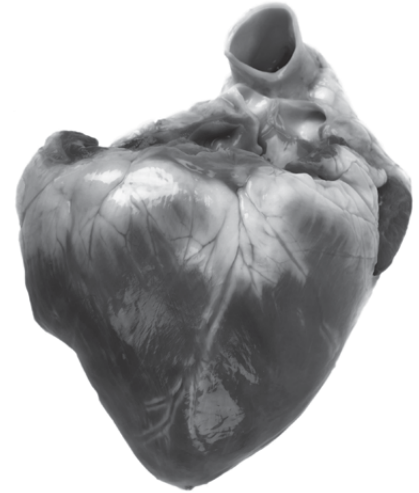
▼ Afb. 51 Varkenshart (buitenaanzicht).