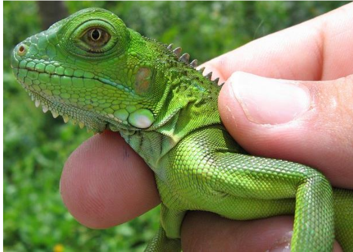
Hanteren van een kleine hagedis. (Iguana iguana)

Kleine hagedissen zijn lastig te hanteren, ze zijn vaak erg snel. Als ze verkeerd gepakt worden kunnen de dieren snel beschadigingen en verwondingen oplopen of hun staart afbreken. Wanneer ze toch gehanteerd moeten worden is de beste manier om snel maar zacht met een iets gebolde tot platte handpalm op het lichaam te drukken. Pak dan met duim en wijsvinger de nek, net achter de kop zodat je niet gebeten wordt. Vervolgens pak je het lijf tussen hand, ringvinger en pink. Vaak is een betere manier om deze diertjes te vangen met een doosje of kokertje.