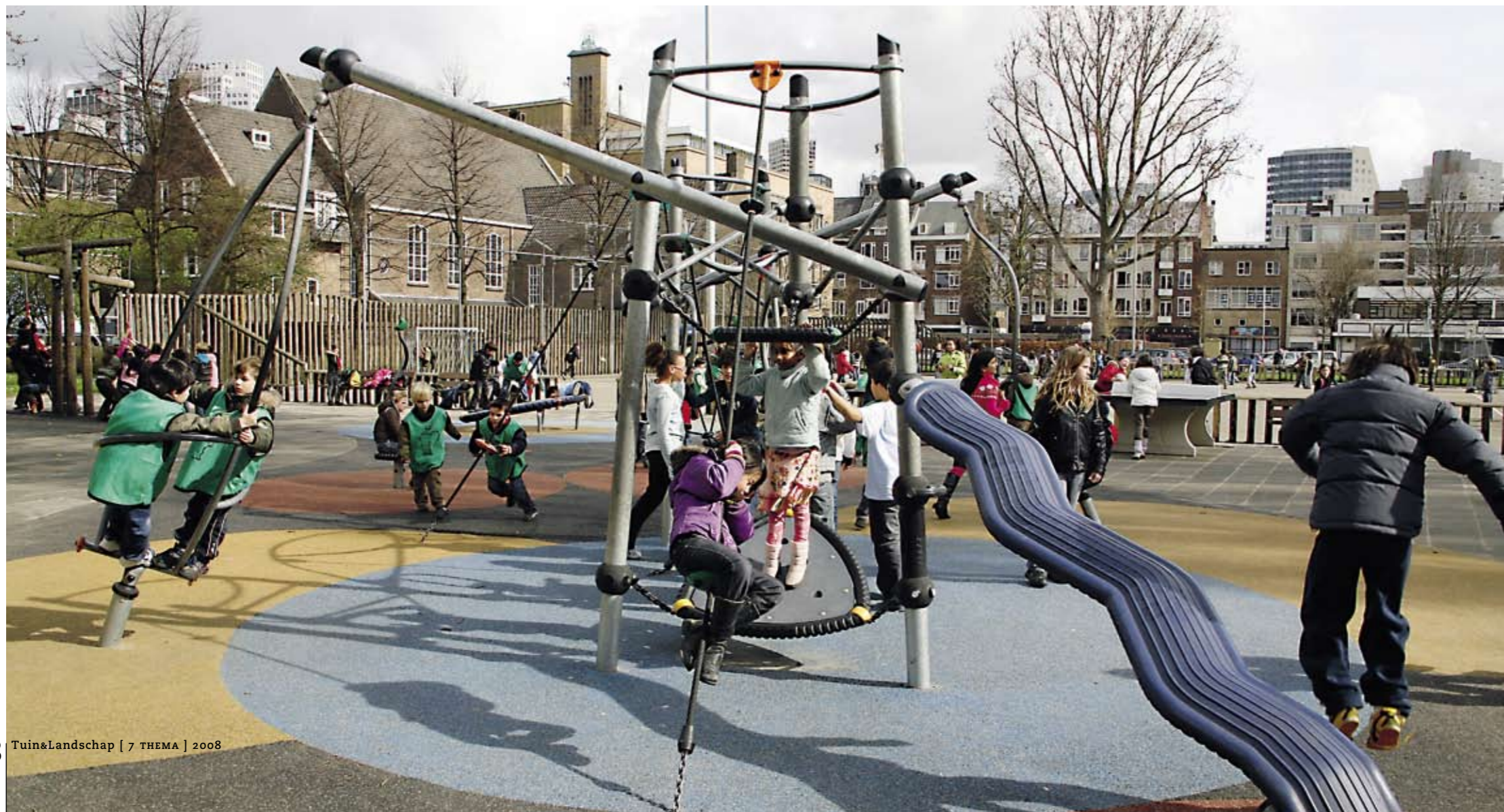
Een speelplek met uitdagende objecten en vriendjes om mee te spelen, vervelt niet snel.

En wat ons zo treft, is de uitkomst van recent onderzoek: 'naarmate er meer verbeeldend wordt gespeeld, is er minder sprake van gedragsproblematiek'. Spelen kost dus geen geld maar is een verantwoorde investering in een leefbare, tolerante en gezondere wereld. ●