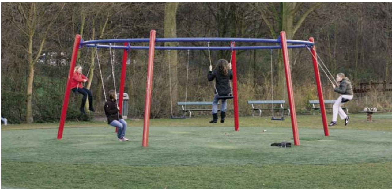
Rondhangende jeugd heeft niet altijd een container nodig. 'Hangen' kan ook op schommels, dan bewegen de jongeren tenminste nog.

en, afhankelijk van de omgeving, kiest hij voor formele of informele elementen, zoals boomstammen om op te zitten of een touwbrug.