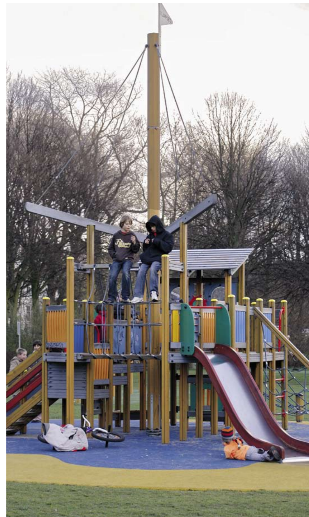
Kinderen moeten zich herkennen in een speelplek. Het gaat erom dat zij leuk kunnen spelen.