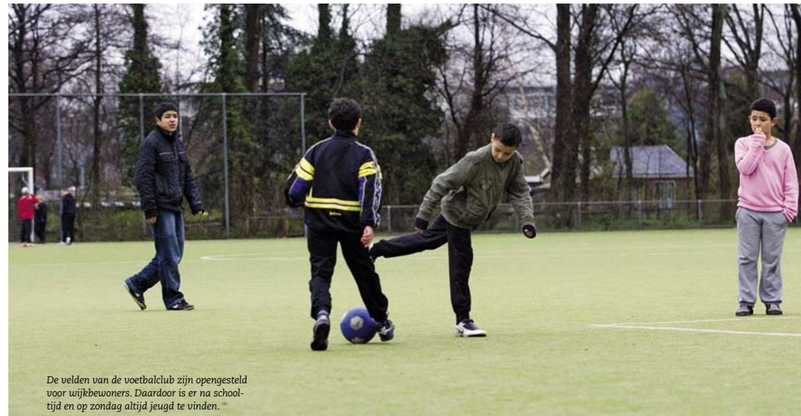
De velden van de voetbalclub zijn opengesteld voor wijkbewoners. Daardoor is er na schooltijd en op zondag altijd jeugd te vinden.

Alle partijen die te maken hebben met het reilen en zeilen van de Tuin van