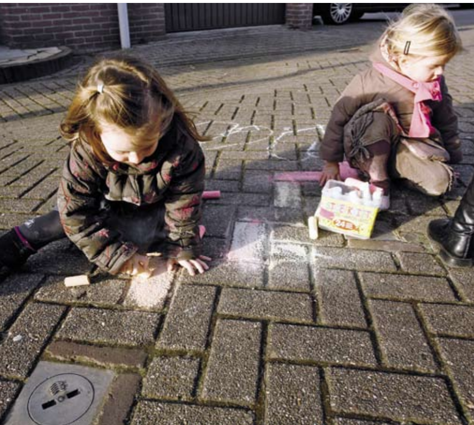
Kinderen hebben niet altijd veel ruimte of speeltoestellen nodig. Een stukje stoep is soms al genoeg.

Een reeks redenen waarom kinderen niet buitenspelen is in dit artikel weerlegd. Voldoende redenen zijn genoemd om kinderen wel buiten te laten ontdekken. Eén is echter nog niet benoemd: overgewicht. Je kan geen blad openslaan en geen actualiteitenprogramma beluisteren of het gaat over de steeds dikker wordende jeugd en alle risico's die daar voor hun gezondheid aan vast zitten. Overgewicht bij kinderen is meestal niet het gevolg van te veel eten maar van te weinig bewegen. Het Kenniscentrum Overgewicht adviseert voor kinderen een uur matig intensieve lichamelijke activiteit per dag. Dat hoeft niet alleen door te sporten: fietsen of lopen naar school telt ook. Wat je ook doet, meestal heb je ruimte nodig, dus: naar buiten. ●