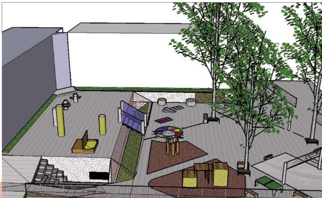
Doorgaans tekent Bros zijn ontwerpen op locatie met de hand. Deze tekening maakte hij, als experiment, met de computer.

Tekst Kyra Kuitert