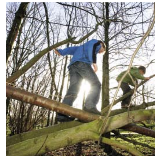
Spelen in de natuur moet ook dicht bij huis mogelijk zijn.

Basis voor de ontwerpen van BuroBlad zijn natuurlijke materialen, zoals hout en grote morene keien. Als bijkomend effect van deze natuurlijk ingerichte speelplekken wijst Doornenbal gemeenten op de uitstraling ervan voor de om-