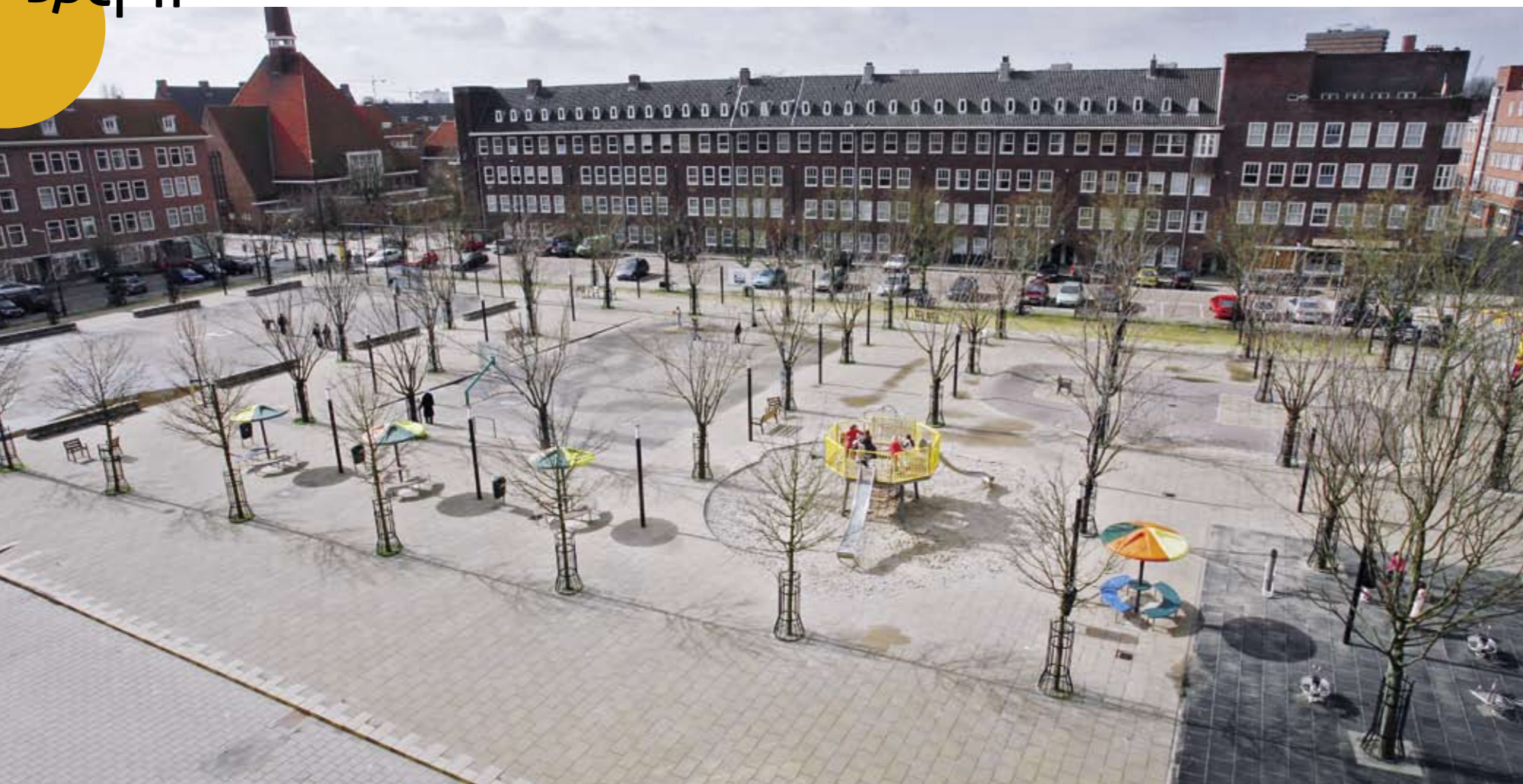
Het Balboaplein in Amsterdam is samen met de kinderen uit de wijk ontworpen.