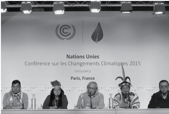
▼ Afb. 21 Klimaatop.