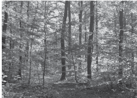
2 gemengd bos