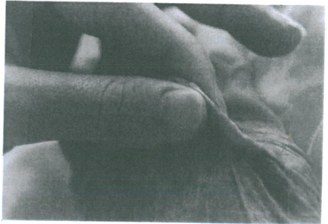
Vermindering van de huidspanning

De gezonde huid is soepel en elastisch. Als je de huid oppakt en weer loslaat, is de huid mooi glad. We spreken dan van een normale spanning van de huid.