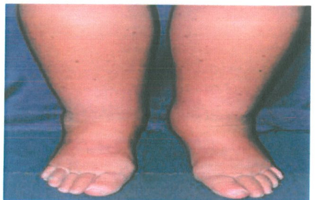
Verschijnselen van oedeem

Als het lichaam vocht vasthoudt in de weefsels, voelt de huid zacht aan en kun je er putjes in drukken. Hierbij verplaats je het vocht even, want kort daarna zijn de putjes verdwenen. Dit noem je oedeem .