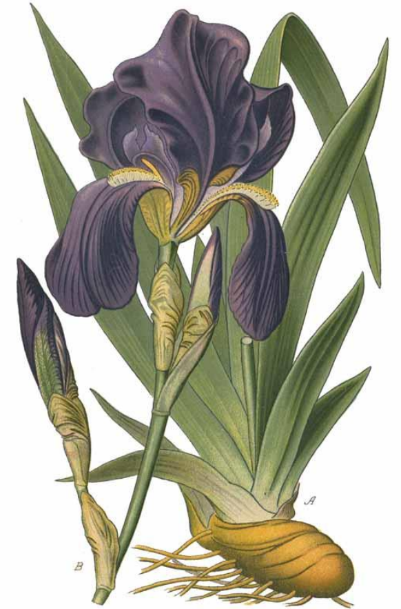
Pl. 329. Iris d'Allemagne. Iris germanica L.