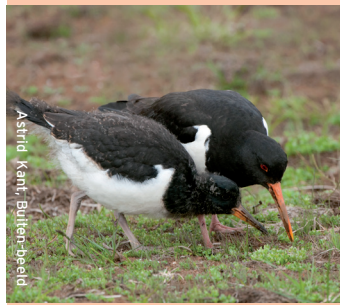
Astrid Kant, Buiten-beeld