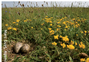
Marc Guyt, Agami

De scholekster legt zijn 3-4 eieren in een ondiep kuiltje. Na ongeveer 25 dagen komen de eieren uit.