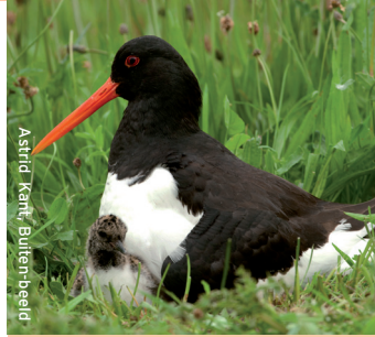
Astrid Kant, Buiten-beeld