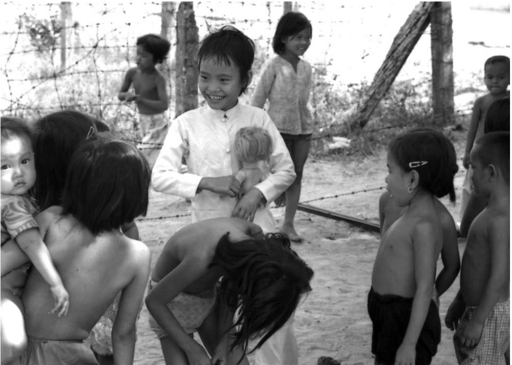
Kim aan het spelen in haar dorp.

Pas toen ze weer thuis was in Trang Bang raakte Kim op de hoogte van de foto van Ut die de wereld was rondgegaan. „Mijn vader haalde de foto uit een la en liet hem aan me zien,“ herinnert Kim zich. „Hij zei: ‘Kim, dit is een foto van jou’. Ik keek naar de foto en was vervuld van schaamte. Want ik ben een meisje. Ik zei: ‘Waarom heeft hij zo een foto van me gemaakt? Zonder kleren! Mijn broer en mijn neefjes en nichtje hadden kleren aan. En we huilden op de foto. Ik vond het lelijk en schaamde me diep. Ik wilde op dat moment dat de foto niet was gemaakt.’”