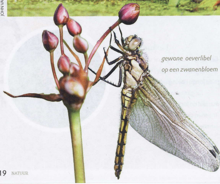
gewone oeverlibel op een zwanenbloem