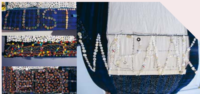
Liefde , Gijs Assmann, 2013

In het midden van de stof heeft Gijs van knoopjes het woord 'liefde' op de stof geborduurd. Rechtsonder staat 'lust' (tekst staat een kwartslag gedraaid). Ook staat er links bovenin het woord 'jaloezie'. Dat is moeilijk te lezen. Op de achterkant staat 'wraak'. Het is leuk om met de klas te bespreken wat de woorden liefde, lust, jaloezie en wraak met elkaar te maken hebben. De stof is rouwkleiding uit het sterk gereformeerde vissersdorp Spakenburg.