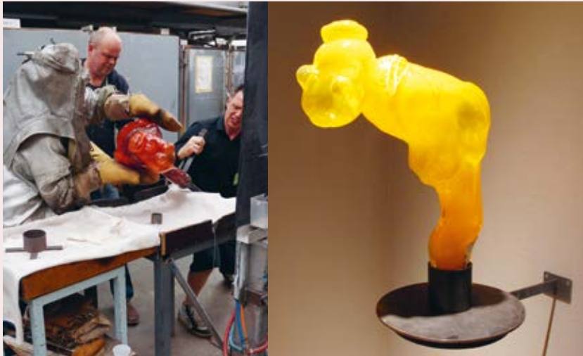
Harmonie (I), Gijs Assmann, 2015, Courtesy Galerie Nouvelles Images, Den Haag