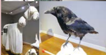
Wraakpaard, Gijs Assmann, 2007