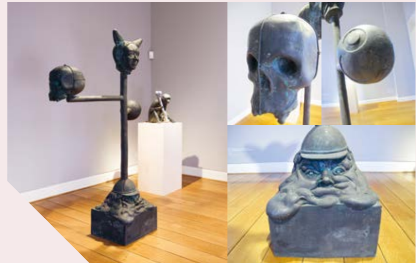
We are because we are because we are because we are (naar Dantan), Gijs Assmann, 1998, Rabo Kunstcollectie

In de film zijn drie van de vier hoofden goed te zien. Die drie hoofden zijn een 'man met een muts met twee horens', een 'bal met smiley-gezicht' en een 'doodshoofd'. Laat de leerling toelichten waarom hij of zij dit hoofd het mooiste vindt. Vraag ook aan de klas wat deze hoofden kunnen verbeelden. En waarom ze samen in één beeld zitten. Het beeld is gemaakt van brons en heet We are because we are because we are because we are (naar Dantan).