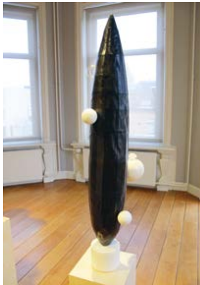
Vanitas (voor Erik) (I), Gijs Assmann, 2010, Collectie AkzoNobel Art Foundation