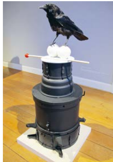
Vanitas (voor Karel), Gijs Assmann, 2013