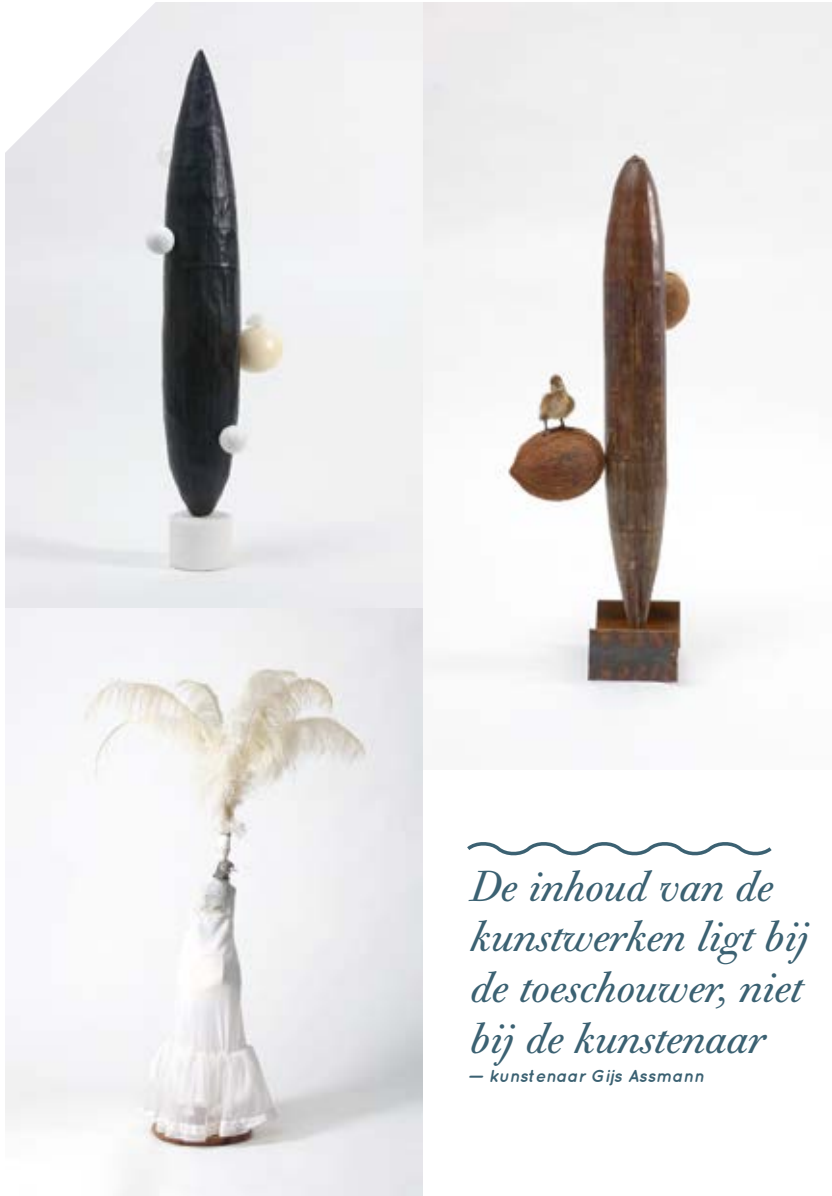
Vanitas (voor Erik) (I), (II) en (III) Gijs Assmann, 2010

De inhoud van de kunstwerken ligt bij de toeschouwer, niet bij de kunstenaar