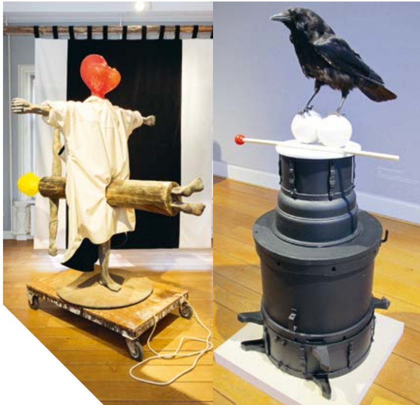
Ode aan Mandela (II) (voor T.P.), Gijs Assmann, 2015