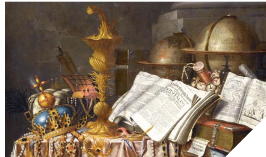
Vanitas-stilleven, Edwaert Collier, 1662, Collectie Rijksmuseum Amsterdam

Een kunstwerk waarin het vanitas-thema de hoofdrol speelt, verbeeldt dat het plezier van het leven slechts een moment duurt. Omdat je tijd op aarde beperkt is, zou je ten volle van het huidige moment moeten genieten. De symboliek van een schedel of overrijp fruit verwijst naar onze sterfelijkheid. Muziekinstrumenten laten de vluchtigheid van muziek zien, die verlinkt zodra de laatste noot is gespeeld.