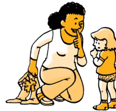
De waarheid zeggen < > Zwijgen