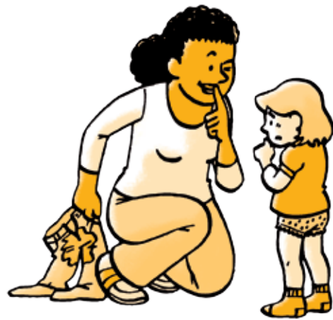
De waarheid zeggen < > Zwijgen