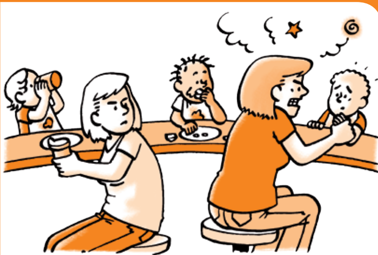
Normen en waarden collega's < > Eigen normen en waarden