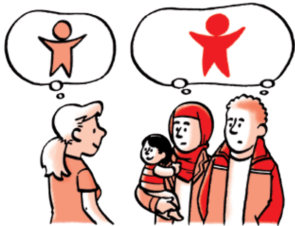
Beeld ouders < > Eigen beeld