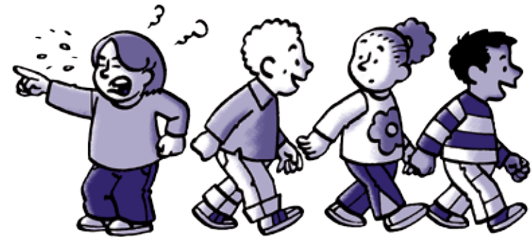
Belang individu < > Groepsbelang