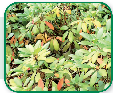
Stikstof gebrek bij Rododendron

Bemesten met OpMaat N11 of één van de Myco-meststoffen.