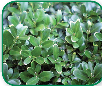
Calcium gebrek bij Buxus

Let op: bij zuurminnende planten halve dosering toepassen.