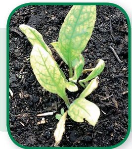
Ijzergebrek bij Longkruid