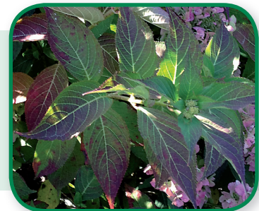
Fosfaatgebrek bij Hortensia

Bemesten met OpMaat P10 of één van de Myco-meststoffen.