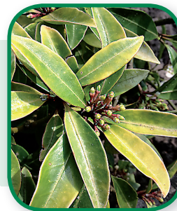
Ijzergebrek bij Skimmia