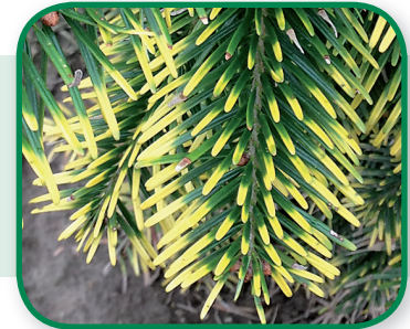
Calcium gebrek bij een Nordmann