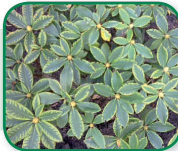
Magnesium gebrek bij Rododendron

Bemesten met OpMaat MgO+ of één van de Myco-meststoffen.