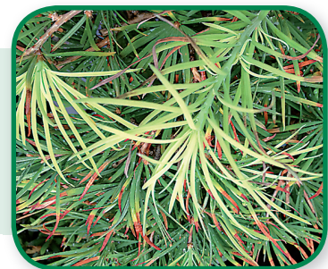
Kalium gebrek bij Ceder