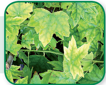
Magnesium gebrek bij Acer