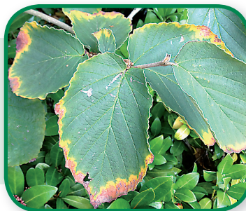
Kalium gebrek bij Beuk

Bemesten met OpMaat K15 of één van de Myco-meststoffen.