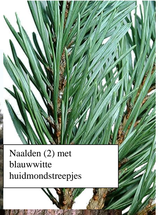
Naalden (2) met blauw witte huidmondstreepjes