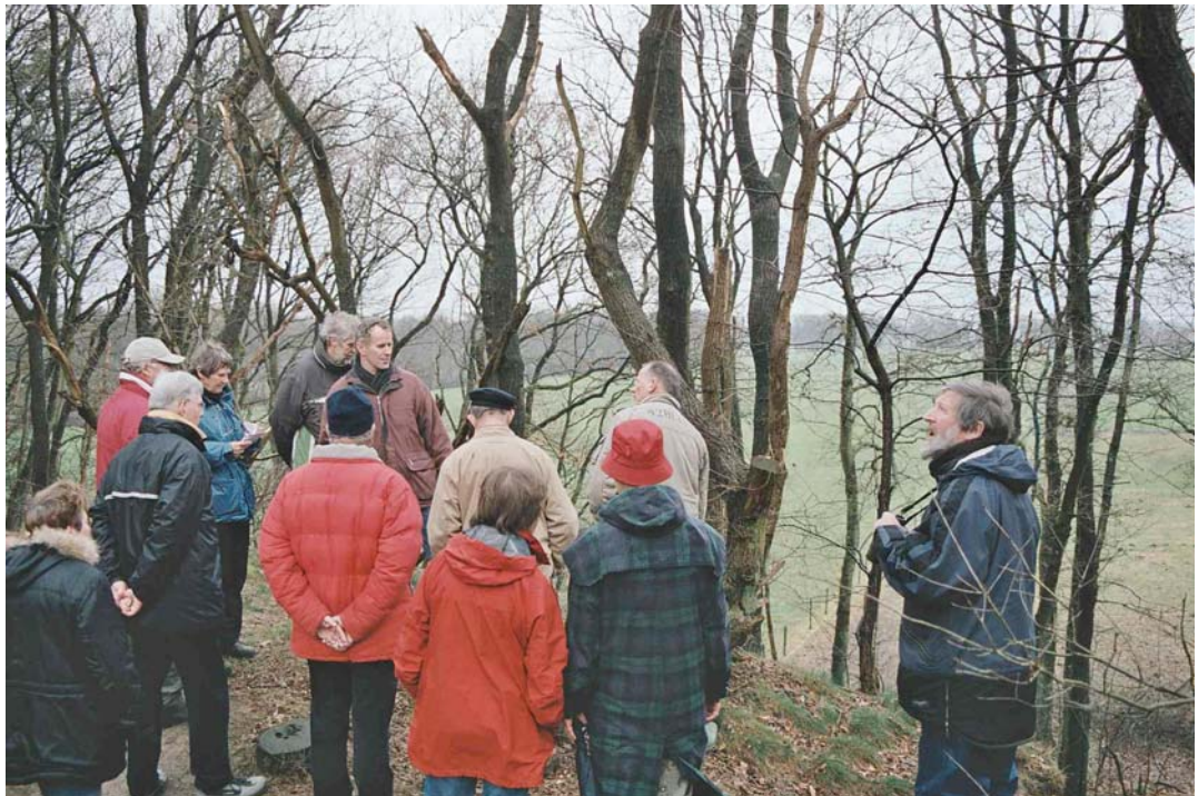
Excursie op een landbouwbedrijf in de overgang van het open Eemland naar de besloten Utrechtse Heuvelrug.

De werkgroep heeft een model ontwikkeld voor excursies op boerenbedrijven in het Nationaal Landschap. De excursies worden opgezet met behulp van de methode Leesbaar Landschap en worden gegeven door een koppel van boer en landschapsgids. De boer belicht de relatie landbouw-landschap vanuit zijn bedrijfsvoering, terwijl de landschapsgids de relatie vanuit het landschapsperspectief belicht. Na afloop van de excursie wordt een gesprek gehouden over de rol van de landbouw in het landschap. Deze excursies zijn herhaalbaar op andere boerderijen en voor verschillende doelgroepen geschikt.