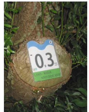
Bordje 'Droge Voeten Route'.