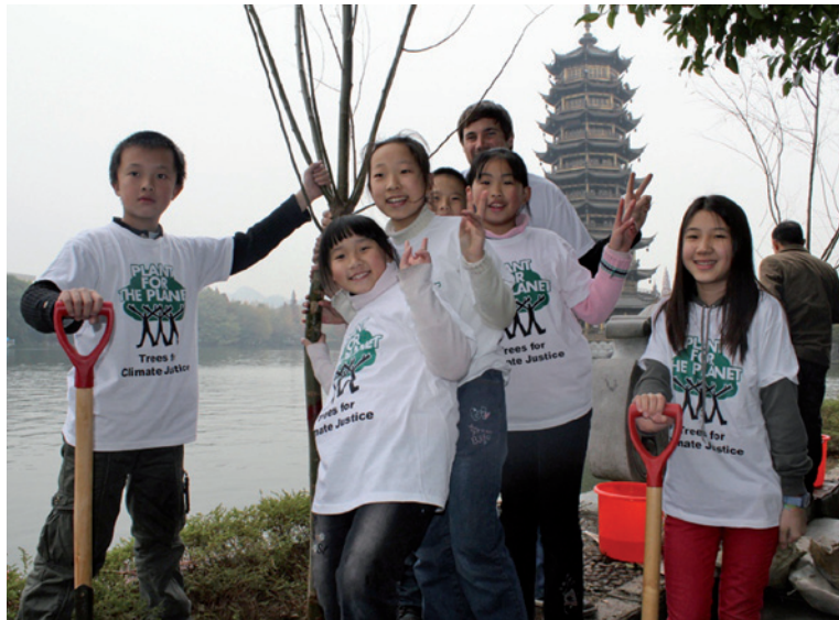
Medeactivisten van Plant-for-the-Planet in China planten bomen, in 2011.