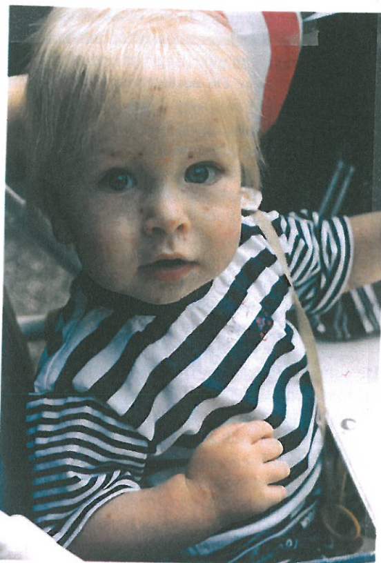
Figuur 1.3 Waterpokken

Waterpokken is een kinderziekte die wordt veroorzaakt door een virus. De incubatietijd bedraagt veertien tot twintig dagen. Vlak voor het ontstaan van de 'pokjes' zijn de kinderen enkele dagen hangerig, huilerig en eten ze slecht. Dan verschijnen in korte tijd rode vlekjes op de huid, die overgaan in blaasjes. De inhoud van deze blaasjes bestaat uit helder vocht. Het vocht uit de blaasjes is zeer besmettelijk voor anderen. De blaasjes drogen na een aantal da-