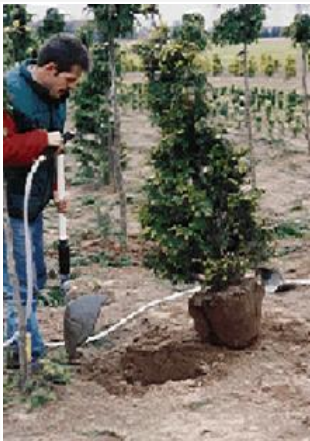
Foto: Pneumatische kluitensteker