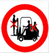
Afbeelding: Verbodsbord meerdere personen op heftruck

Let op! Deze informatie is afkomstig uit de arbocatalogus agrarische en groene sectoren. De arbocatalogus wordt regelmatig geactualiseerd. Voor de meest actuele informatie verwijzen wij u daarom naar www.agroarbo.nl .