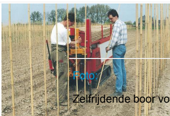
Foto: Zelfrijdende boor voor stokken zetten