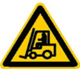
Afbeelding: Gele waarschuwingssticker met heftruck