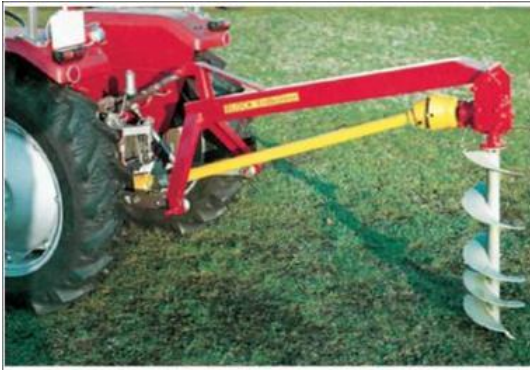
Foto: Boorunit aan de trekker