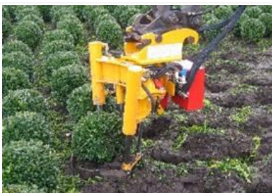
Foto: Kluitrooimachine voor minigraver