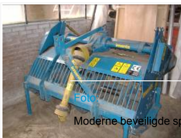
Oude beveiligde spitmachine