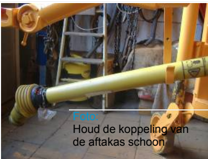
Foto: Houd de koppeling van de aftakas schoon