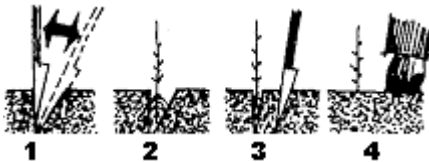
Fig.5: 1. Gleuf met spade maken. 2. Stek voldoende diep in de gleuf plaatsen 3. Gleuf toe doen. 4. Goed aandrukken zodat de stek vastzit.

Vanaf maart kan men deze winterstekken afzonderlijk uitplanten in volle grond. De stekken vertonen meestal dan callus of wondweefsel en wortelaanleg. Het is best dat ze nog geen wortels hebben gevormd, want deze breken toch af.