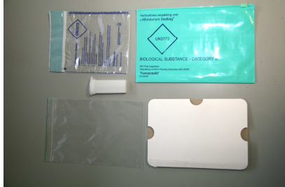
Foto 1: Voor het verzenden cytologisch materiaal zijn nodig: Gelabelde objectglasjes Objectglascontainer Stofvrij zakje (zoals bijv. een gripzakje, sealbag e.d.) Kartonnen inlay Luchtkussenenveloppe /easy slider met de door TNT vereiste bedrukking