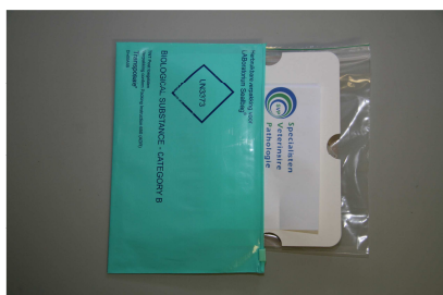
Foto 5: Plaats de inlay met inhoud en los inzendformulier in de luchtkussenenveloppe of easy slider.

Foto 4: Vouw de kartonnen inlay om het gripzakje.