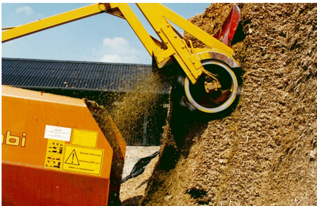
Snijmaïs dankt zijn hoge voederwaarde met name aan het hoge zetmeelgehalte