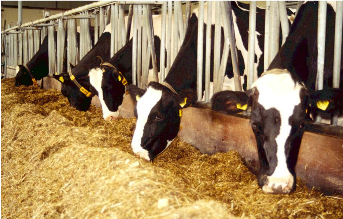
Goede voeropname met snijmaïs