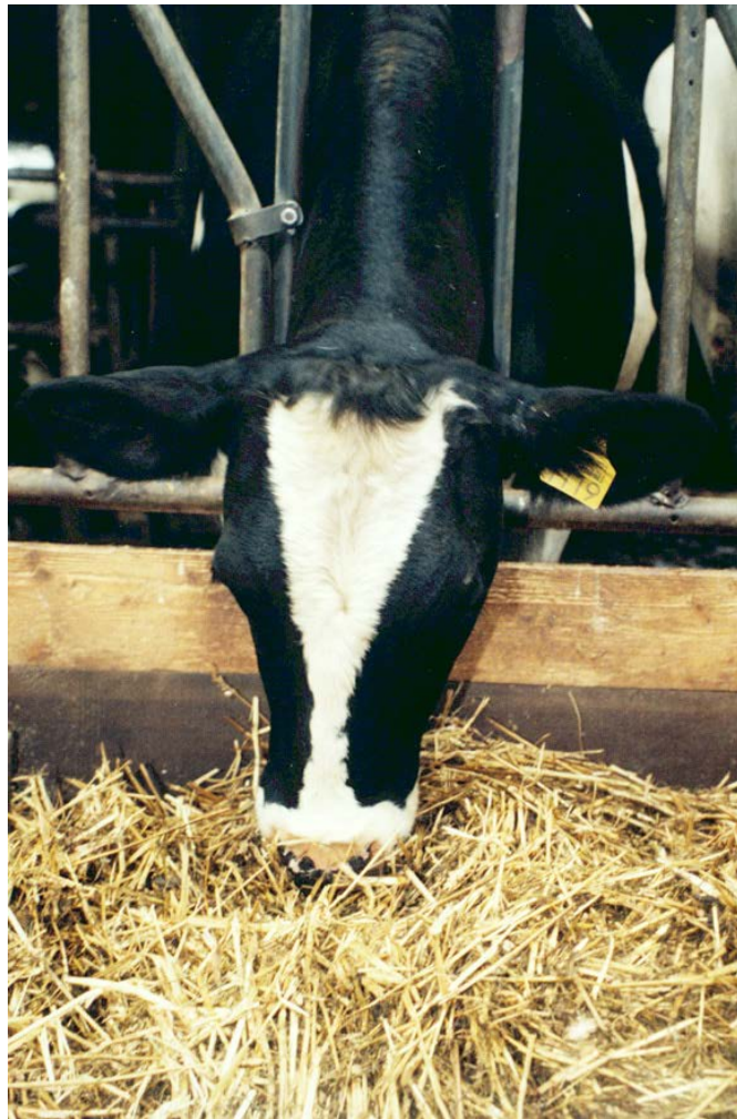
Stro in het rantsoen kan structuurgebrek opheffen