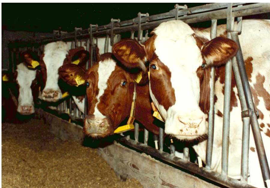
Uitsluitend snijmaïs voor melkkoeien op Cranendonck van 1986-1991

Onder sommige specifieke bedrijfsomstandigheden kan het een optie zijn om uitsluitend snijmaïs als ruwvoer te gebruiken, bijvoorbeeld als er geen of een te kleine huiskavel is of wanneer er geen of te weinig grond beschikbaar is voor ruwvoerproductie. Op praktijkcentrum Cranendonck is een systeemvergelijking uitgevoerd tussen een bedrijfssysteem met gras en snijmaïs en systeem met uitsluitend snijmaïs.