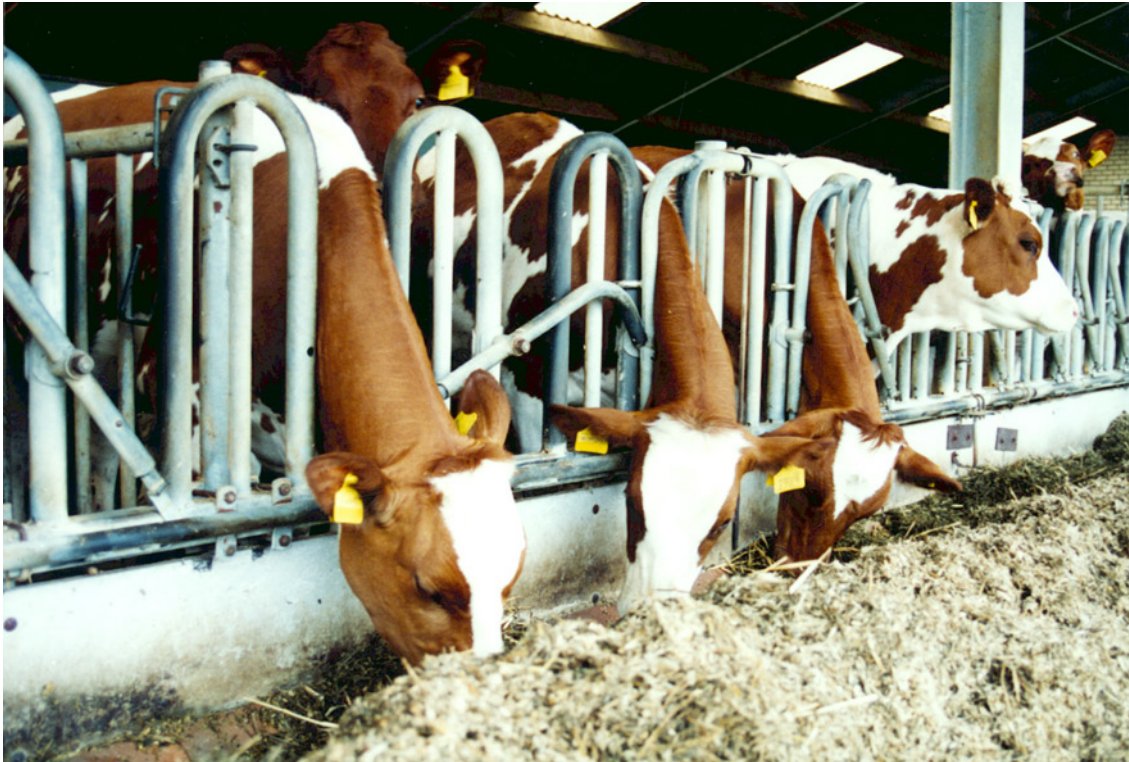
Grotere kans op vervetting bij jongvee met veel snijmaïs

Snijmaïs past ook goed in rantsoenen voor jongvee, maar ook hier bestaat een risico voor vervetting. Bij jongvee jonger dan 1 jaar dat naast ruwvoer nog (eiwitrijk) krachtvoer krijgt, kan men snijmaïs als enig ruwvoer gebruiken. Bij het oudere jongvee moet de hoeveelheid snijmaïs worden beperkt tot maximaal 40% van het ruwvoer.