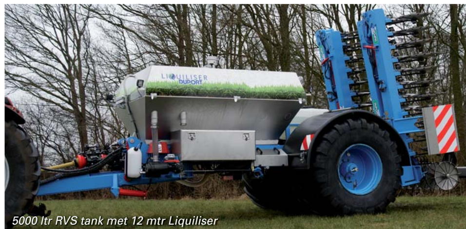
5000 ltr RVS tank met 12 mtr Liquiliser