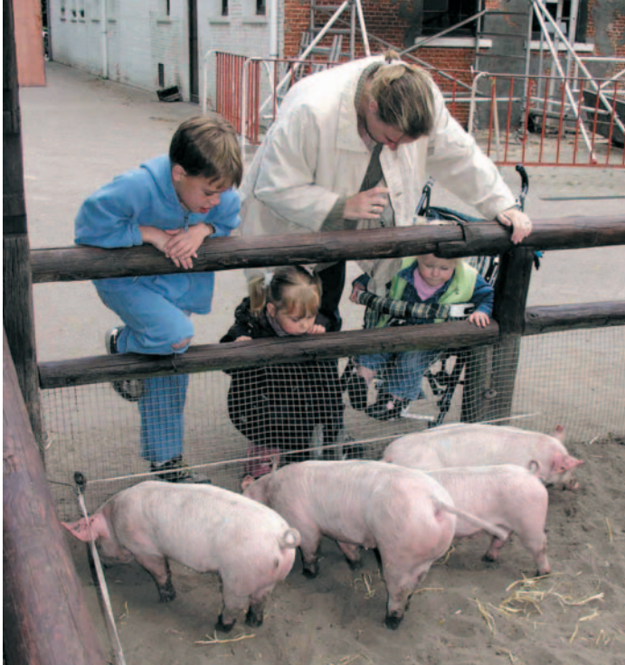
BIGGETJES ZIJN ALTIJD LEUK.

Je noemt de worp van een zeug een toom biggen. Wanneer de biggen minstens acht weken oud zijn, kunnen ze gespeend worden. Eerder afspenen heeft negatieve gevolgen voor het welzijn van het dier. Laat de biggen wel al vroeg met mensen kennismaken. Dan krijg je een sociaal biggetje dat niet bang is voor mensen. Als je merkt dat een biggetje onvoldoende melk binnenkrijgt, kun je het bijvoeren met speciale biggenmelk.