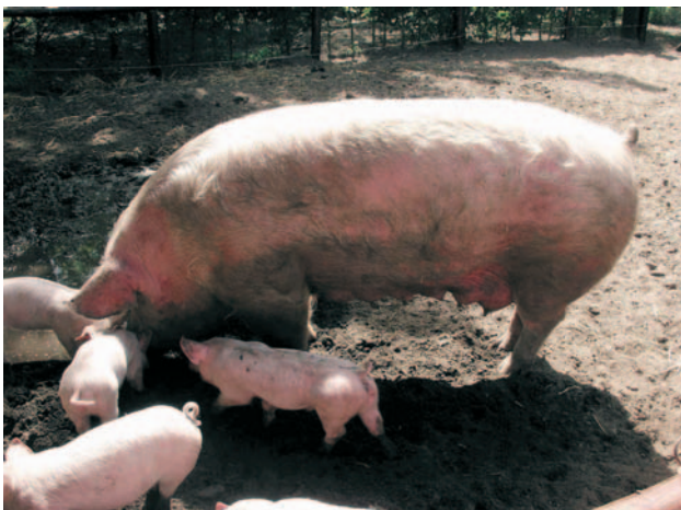
SNUFFELEND AAN HET MODDERPOELTJE

Een varken wroeft graag in de grond. Dit voorkomt verveling. Geef het dier daarom een uitloop naar buiten. Met een gat in de tuin en een emmer water heb je snel een modderpoeltje . Zo kan het varken in zijn buitenverblijf de modder in wanneer hij maar wil. Productievarkens krijgen vaak een bal in hun stal om verveling tegen te gaan.