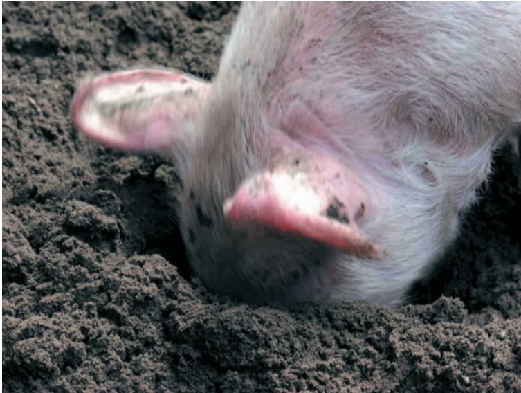
EEN WROETEND BIGGETJE

bouw Varkens hebben een gedrongen bouw . Ze hebben een grote romp, een korte hals en een grote kop. De ogen zijn klein. Varkens kunnen ook niet zo goed zien. Erg opvallend is de snuit. De korte snuit eindigt in de zogenaamde wroetschijf . Met de wroetschijf kunnen varkens goed in de aarde wroeten op zoek naar voedsel. Varkens kunnen erg goed ruiken. Ze worden daarom ook gebruikt om voor mensen truffels te zoeken.