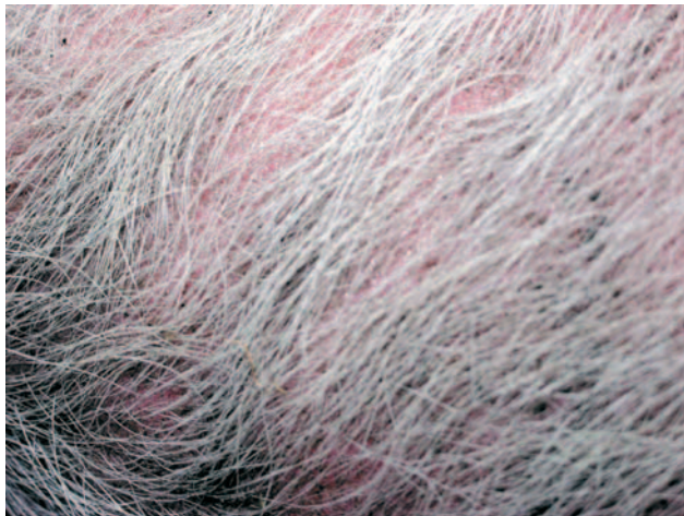
HUID VAN HET VARKEN

Maar een varken verzorgt ook zichzelf. Hij houdt zijn huid zelf in conditie door zo nu en dan een modderbad te nemen. De modder verwijdert parasieten, maar ook de dode huilschilfers. En het voorkomt uitdroging van de huid. Af en toe een beetje uiercrème smeren helpt ook om de huid in topconditie te houden.