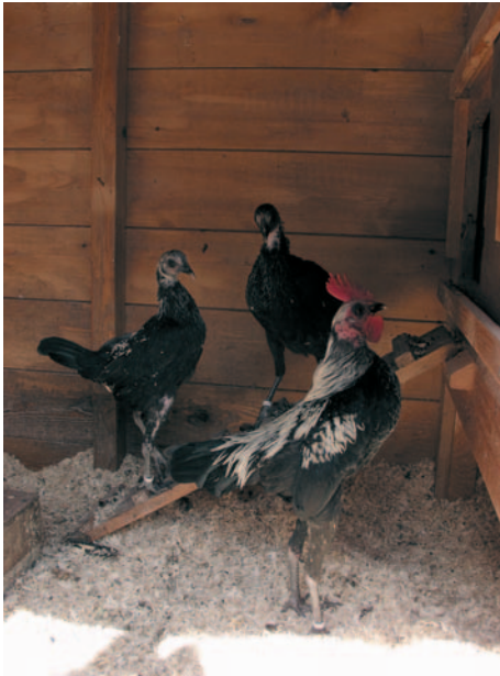
MODERNE ENGELSE VECHTHOEN

Deze vechthoenen zijn sterk opgericht. Dat geeft een slanke indruk. Die slanke indruk wordt nog sterker door de schaarse bevedering die strak om het lichaam zit. Ze hebben een lange dunne hals en een korte horizontaal gedragen staart. Ze hebben een enkele kam en kleine dunne kinlellen. Enkele voorbeelden van de kleurslagen zijn patrijs, zwart en wit. Hanen wegen 2 tot 3 kilo, hennen 1,75 tot 2,5 kilo.