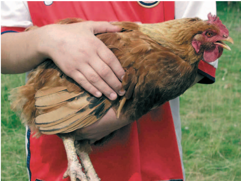
HET HANTEREN VAN DE KIP OP DE ARM