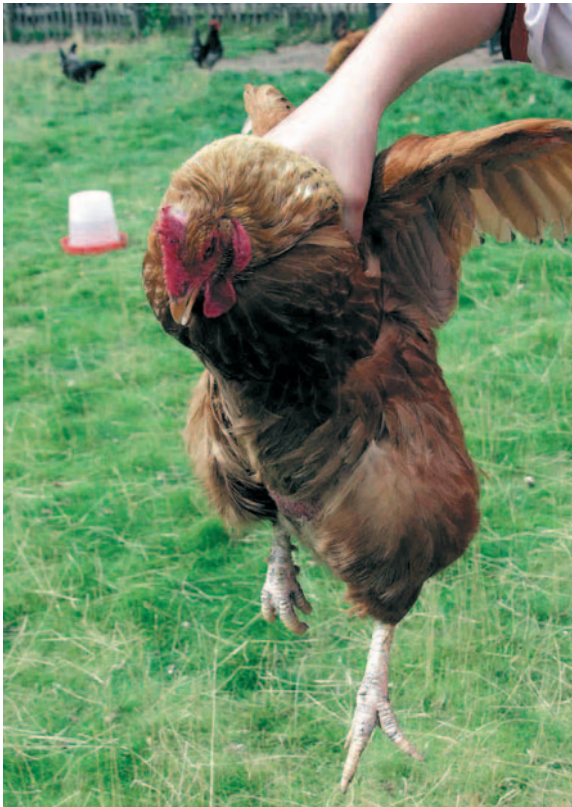
HET HANTEREN VAN DE KIP AAN DE VLEUGELS

en pink. De kip kan nu rusten op je arm. Je houdt de kip tegen je lichaam aangedrukt. Hierbij houd je de ene vleugel klem tussen jouw lichaam en dat van de kip. De andere vleugel houd je vast met je duim.